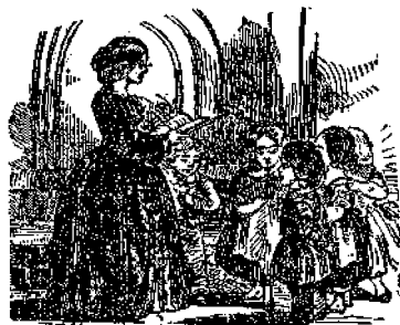
ΥΜΝΟΣ ΕΙΣ ΤΟΝ ΘΕΟΝ

Ἄλλὰ καὶ εἰς ἄλλα καταφεύγει μέσα ὁ κάτοικος οὗτος τοῦ ἀέρος ὅπως τρέφεται. Ἄν καὶ, ὡς εἴπομεν, δὲν δύναται νὰ εἰσδύσῃ εἰς τὴν θάλασσαν, διὰ νὰ συλλάβῃ ἰχθύας, ὅμως δύναται νὰ ἀρελῆται ἐκ τῶν κόπων ἄλλων πτηνῶν. Ἴδου λοιπὸν τί κάμνει παραφυλάττει κἀνὲν ἐκ τῶν πτηνῶν ἐκείνων τὰ ὁποῖα βυτοῦσιν εἰς τὴν θάλασσαν καὶ συλλαμβάνουσιν ἰχθύας, καὶ ἐταν τὸ ἴδιον ἀνερχόμενον καὶ φεύγον μετὰ τῆς λείας του, εἰς τὴν στιγμὴν τὸ Φρεγάτα-πτηνὸν κατέρχεται ἐπ' αὐτοῦ ἐπιθετικῶς καὶ μετὰ τοσαύτης ὀρμῆς καὶ ταχύτητος, ὥστε τὸ πτωχὸν πτηνὸν καταπληχθὲν ἀναγκάζεται καὶ ἀφίγει εἰς τὸ κενὸν τὸν ἰχθὺν τὸν ὁποῖον συνέλαθε· τότε δὲ ὁ ἄρπαξ οὗτος σταματᾷ πρὸς στιγμὴν παρατηρεῖ τὴν καταπίπτουσαν λείαν, ἐπέρχεται καὶ πάλιν κατ' αὐτῆς, ἐπ' ἴσης μεθ' ὀρμῆς καὶ τὴν συλλαμβάνει πρὶν ἔτι πέσῃ εἰς τὴν θάλασσαν.