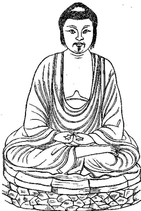
Ναὸς τοῦ Δαιβότου ἐν Ἰαπωνίᾳ.

Εἶχον ἀποφασίσει νὰ ἐκδώσω διὰ τῆς Ἐφ. τῶν Παίδων βραχεῖαν περιγραφὴν τῆς Βαυαρίας, ἀγάλματος ὀρειχαλκίμου κολοσσαίου, τὸ ὅποιον εὐρίσκεται εἰς τὸ Μόναχον καὶ παριστάνει γυναῖκα κρατοῦσαν στέφανον, ὅτε περιτῆθεν εἰς χεῖράς μου φυλλάδιον περιέχον τὴν προκειμένην εἰκονογραφίαν, καὶ μετ' ἑκαμὲ νὰ τὴν προτιμήσω ὡς μᾶλλον ἐνδιαφέρουσαν.