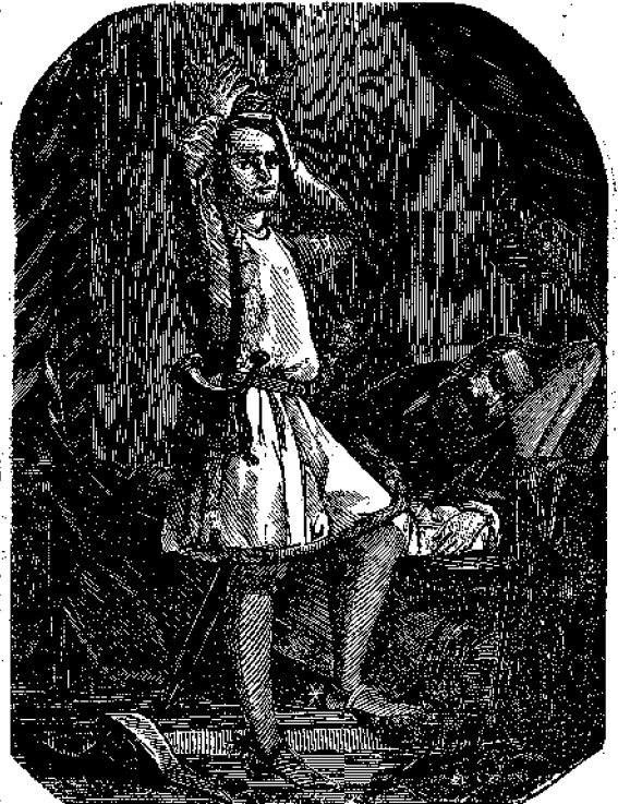
Ὁ Πρῆκτῃς Ἐρρίκος δοκιμάζων ἐπὶ τῆς κεφαλῆς του τὸ στέμμα τοῦ πατρὸς του.

Τὰ κρέας τοῦ ἐπὶ τῆς βίβας τοῦ κορτώματος, τὸ ὁποῖον εἶναι σχεδὸν τόσον ὀψηλόν, ὡς τὸ τῆς καμήλου, θεωρεῖται ὑπὸ τῶν ἐντοπίων ὡς τρυφερώτατον καὶ νοστιμώτατον. Τὰ ζῶα ταῦτα εἶναι πολλὰ ἄγρια καὶ περιπλανῶνται ἀγέληδόν· συλλαμβάνονται δὲ εἰς λαίκκους ἐπίτηδες ἐκακαμμένους ὑπὸ τῶν κυνηγῶν πρὸς τὸν σκοπὸν τοῦτον.