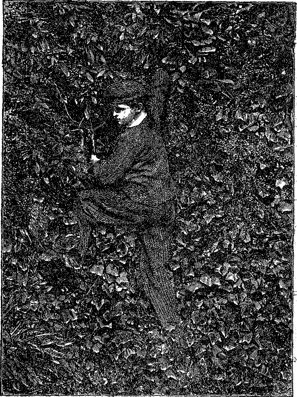
Ο Μάιος Μήν.

Μετά τοῦ μηνὸς τούτου εἶμαι συνδεθεμένοι πλεῖστοι γλοκεῖται ἀναμνήσεις καὶ ἐπεισόδια μεταξὺ δὲ τῶν κατοίκων τοῦ βορείου ἡμισφαιρίου εἶμαι πάντοτε ὠραῖος καιρὸς, ἐνφ.εἰς τοὺς κατοίκους τῆς Αὐστραλίας καὶ τῆς Νέας Ζηλανδίας ὁ μὴν οὗτος εἶναι ψυχρὸς καὶ βροχερὸς, διότι εἰς τὸ νότιον ἡμισφαίριον ὁ Μάιος εἶναι ἡ ἀρχὴ τοῦ χειμῶνος καὶ ἀντικατοίχει μὲ τὸν ἰδικόν μας Δεκέμβριον.