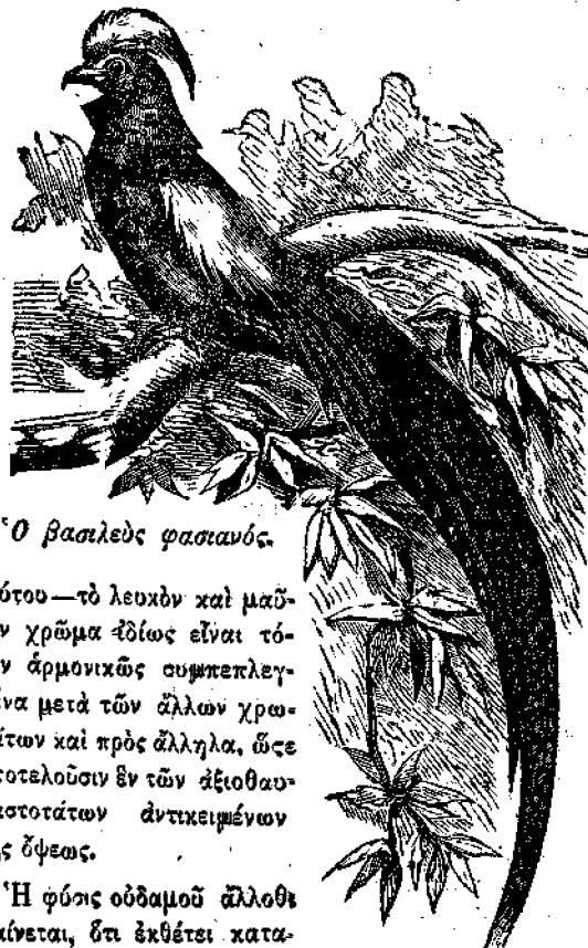
Ὁ βασιλεὺς φασιανός.

Εἶναι δύσκολον νὰ περιγράψῃ τις ἀρκούντως τὴν ὀφραιότητα καὶ λαμπρότητα τῶν πτερῶν τοῦ πτηνοῦ