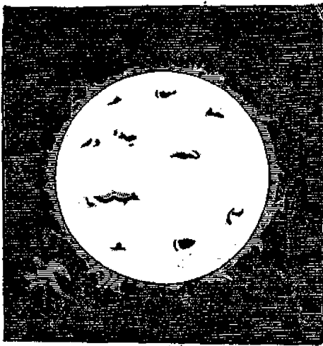
Ὁ ἥλιος ὅπως φαίνεται διὰ τηλεσκοπίου.

Ἴσως ἀπορήσωσιν οἱ πρεσβύτεροι καὶ γελασώσιν οἱ μικροί μας· ἀναγνῶνται ἀναγνώσκοντες τὴν ἐπι- γραφήν αὐτήν. Τί! ἀστρονομικὰ εἰς τὴν ἑφημερίδα τῶν Παιδῶν; Ἀστρονομίαν διὰ μικρὰ παιδιά! Καὶ διατί ὄχι ἀστρονομίαν διὰ τὰ παιδιά; μήπως τὰ παι- διά δὲν εἶναι ὄντα λογικὰ; δὲν ἔχουσι νοῦν δυνάμε- νον νὰ συλλαμβάνῃ καὶ νὰ καταλαμβάνῃ καὶ ἀστρο- νομίαν; Βεβαίως καὶ αὐτὰ τὰ παιδιά δύνανται νὰ μάθωσι πολλὰ πράγματα ἀναφερόμενα εἰς τὴν Ἀ- στρονομίαν, ἀρκεῖ νὰ ἐκτεθῶσιν εἰς αὐτὸ εἰς γλῶσ- σιν ἀπλήν καὶ κατὰ τρόπον ἀρμόζοντα εἰς τὰς δι- δακτικὰς αὐτῶν δυνάμεις, ὥστε νὰ δύνανται νὰ τὰ ἐγνωθῶσιν.