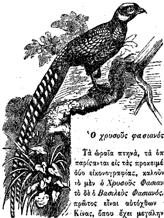
Ὁ χρυσοῦς φασιανός

Τὰ ὄφραια πτηνὰ, τὰ ὁποῖα παρίστανται εἰς τὰς προκειμένας δύο εἰκονογραφίας, καλοῦνται τὸ μὲν ὁ Χρυσοῦς Φασιανός, τὸ δὲ ὁ Βασιλεὺς Φασιανός. Ὁ πρῶτος εἶναι αὐτόχθων τῆς Κίνας, ἔπου ἔχει μεγάλην ὑπέροχον ὄχι μόνον διὰ τὰ ὄφραια πτερά, ἀλλὰ καὶ διὰ τὸ τρυφερὸν καὶ νόστιμον κρέας του. Ὁ δεύτερος ἀπαντᾷται μόνον εἰς τὰ βορειότατα μέρη τῆς Σινικῆς αὐτοκρατορίας, ἡ δὲ πατρίς αὐτοῦ εἶναι τὰ χιονοσκεπῆ ὄρη τῆς Σουριναγάρ.