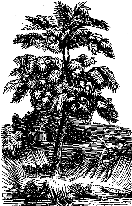
ΚΟΜΜΙ ΤΟ ΕΛΑΣΤΙΚΟΝ.

κατά ἓν ἔτος μεγαλειτέρους ἔνεκα τῆς ὀμιλίας ταύτης τοῦ ἀγπιοῦ αὐτῶν πατρός. (ἀκολουθεῖ.)