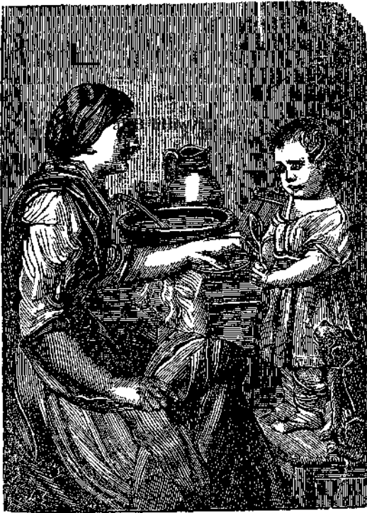
Παιδῶν ζητοῦν τὴν εὐλογίαν τοῦ Θεοῦ εἰς τὸ γεῦμα.

« Μὴ πλανᾶσθε· Φθείρουσι τὰ καλὰ ἤθη αἱ καὶ συναναστρόφαί.» (Α' Κορινθ. ἐβ. 33.)