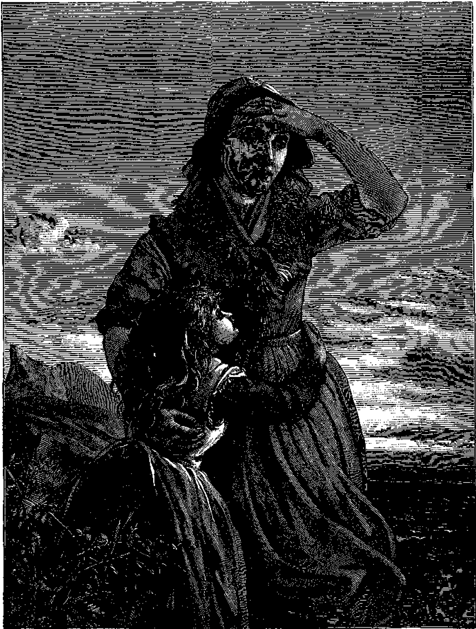
Μήτηρ καὶ τέκνον ἀναμένουσαι τὸν ἀπόντα πατέρα.

ματὰ — ἤρκει ὅτι τὸ τραγουδάκι του ἔβαλλεν ἡ μεγάλη αἰδὸς τῆς Εὐρώπης! Ἄλλ' ἡ προαίσθησις του δὲν διεψεύσθη — αὐτὴν ἐκείνην τὴν νύκτα εἰς τῶν μεγαλειτέρων ἐκδοτῶν τῆς πόλεως ἐπρόσφερε 300 λίρας διὰ τὸν ὕμνον, ἡ δὲ κυρία Μελίβραν