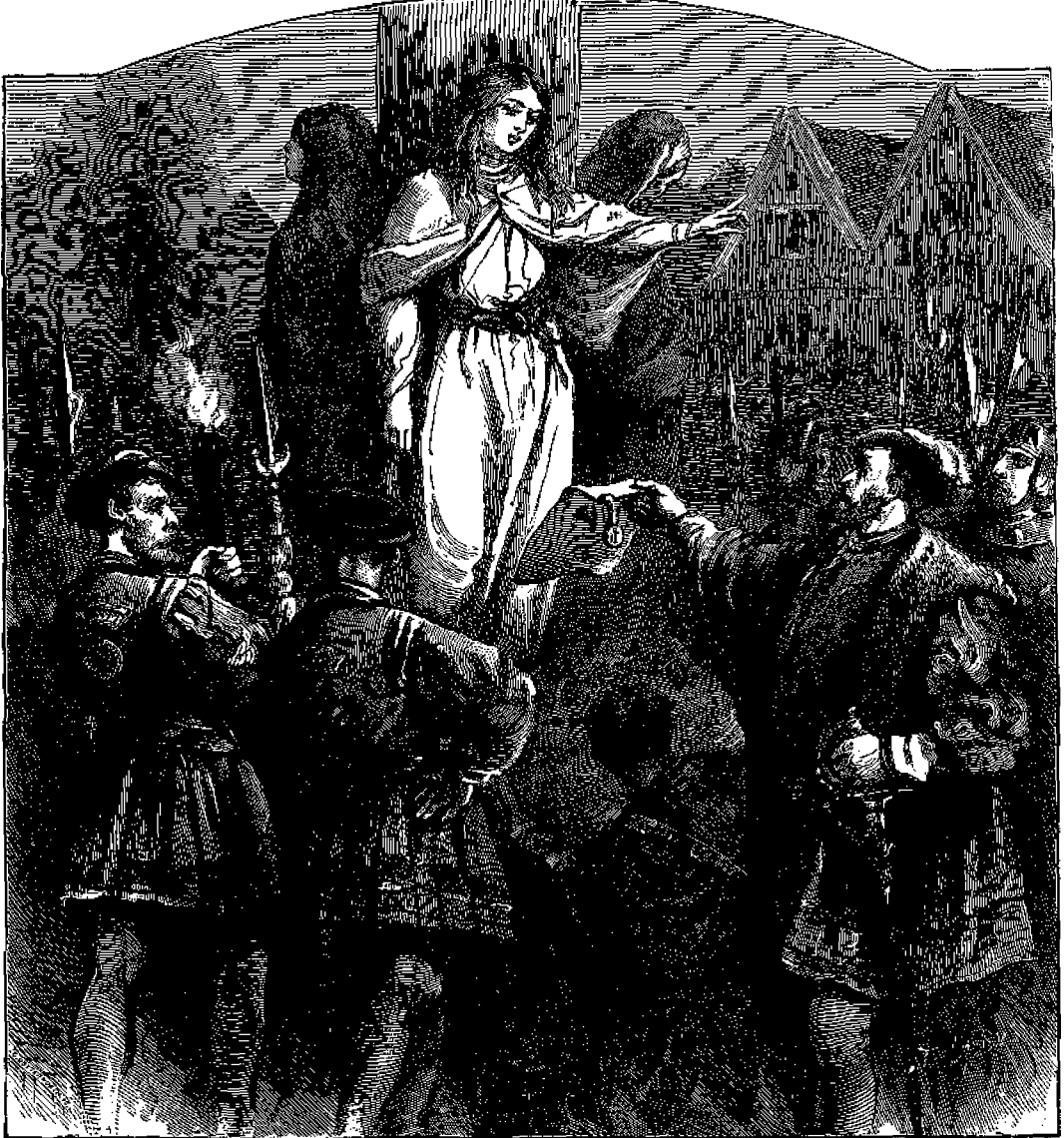
*ἡ μάρτυς Ἰουλία ἀρνούμενη νὰ ζύγομαζῆ ἀρνησιν εἰς Χριστόν.

Εἰς ἐν δὲ τῶν ταξειδίων του εἰς τὰ μεσημβρινὰ μέρη τῆς Γαλλίας ἔλαβεν αὐτὴν μεθ' ἑαυτοῦ διὰ νὰ ἀλλάξῃ τὸ κλίμα, διότι ἕνεκα τῆς μεγάλης ἐγκρατείας τῆς εἰς ὄλα, ἡ ὑγεία τῆς ἤρχισε νὰ πάσχῃ. Ἐπειδὴ δὲ τὸ πλοῖον κατὰ τύχην ἠγκυροβόλησεν ἐξωθεν τῆς Κορσικῆς, ὁ κύριός τῆς