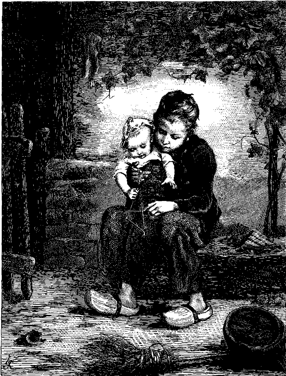
Ὁ Γεώργιος καὶ τὸ μωρό.

Ἡ προκειμένη εἰκὼν δεικνύει τὰ συγκριτικὰ ὕψη τῶν κυριωτέρων Κολοσσῶν.