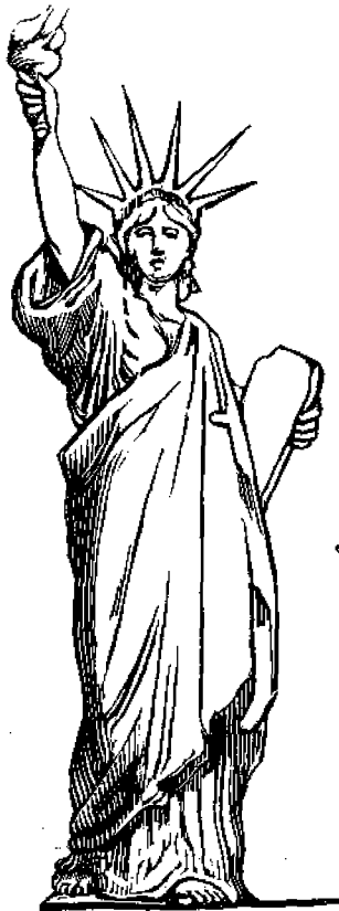
Ἡ διὰ Ἑλευθερία.

Καλὴν νύκτα, ἀδελφοῦλά μου—εἶπεν ἡ μικρὰ Ἑλπιτικὴ—δὲν θὰ μουρμουρῶσω πλέον διὰ τίποτα—καὶ κλείσασα τὰ μ' αὐτάκια τῆς ἀποκοιμήθη γλυκύτατα ἕως