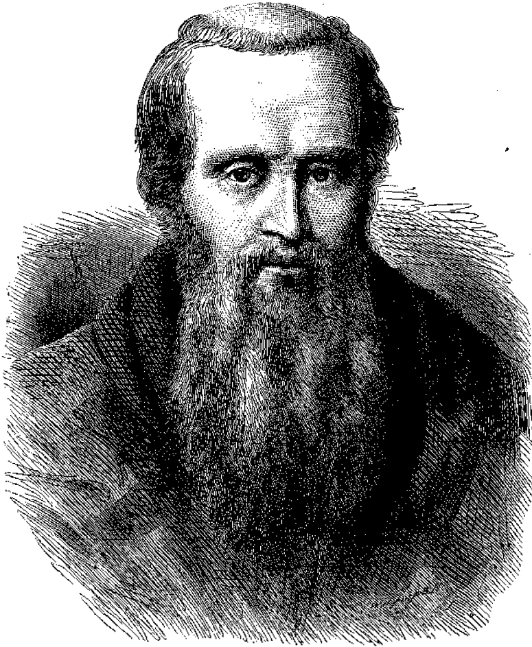
Ἰωάννης ὁ Χρυσόστομος.

Μετὰ τὴν ἀποπεράτωσιν τῶν φιλοσοφικῶν καὶ ῥητορικῶν σπουδῶν του, ἀντὶ νὰ ἐπιδοθῆ εἰς αὐτὰς, ἐπροτίμησε τὸ τοῦ Ἱεροκλήρου ἐργον. Ὄθεν βαπτισθεὶς ὑπὸ τοῦ Ἐπισκόπου Ἀντιοχείας Μελετίου τῷ 369 προχειρίσθη πρῶτον μὲν Ἀναγνώστης. Τὸ ἔργον τοῦτο ἐξηκολούθησεν ἐπὶ τινα ἔτη, ὅταν δὲ ὁ Μελέτιος ἀπέθανεν καὶ ἡ ἐν Ἀντιοχείᾳ Ἐκκλησία ἐζήτησε νὰ θέσῃ αὐτὸν εἰς τὸ ἐπισκοπικὸν ἀξίωμα, οὗτος ἠρνήθη καὶ