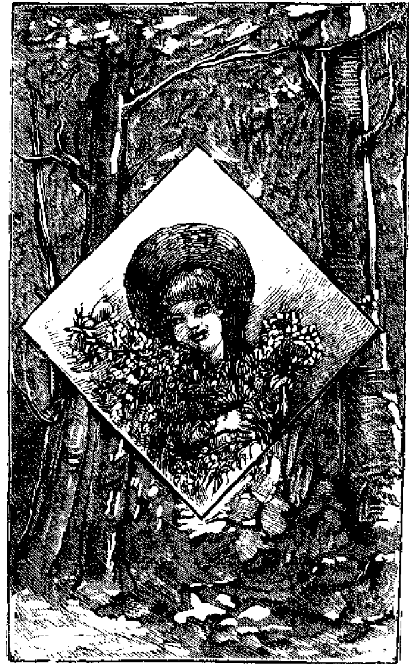
Ἡ φιλόστοργος κόρη.

— Ὅπου εἰσέλθῃ ὑπερηφάνεια, εἰσέρχεται καὶ καταισχύνῃ. Ἡ δὲ σοφία εἶναι μετὰ τῶν ταπεινῶν (Παροιμ. α. 2.)