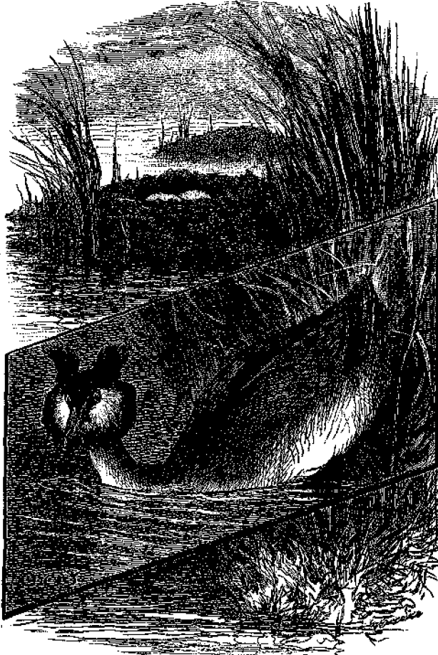
Ἡ Λοφωτὴ Γρέβα.

Δυστυχῶς ἕνεκα τῆς ὠραιότητός της ἡ Γρέβα σχεδὸν ἐξήφανισθῆ ἐν Ἀγγλίᾳ, διότι τὰ πτερά καὶ τὸ στήθος της ἀποτελοῦν περιζήτητον κόσμημα διὰ τοὺς πῖλους τῶν κυριῶν. Καὶ οὕτω φονεύονται κατὰ χιλιάδας τὰ ὄρα καὶ ἄθῳα ταῦτα πτηνά, ἀπλῶς καὶ μόνον διὰ νὰ εὐχαριστήσουν τὰς πολυτελεῖς ἀπαιτήσεις τῶν φιλαρέσκων γυναικῶν.