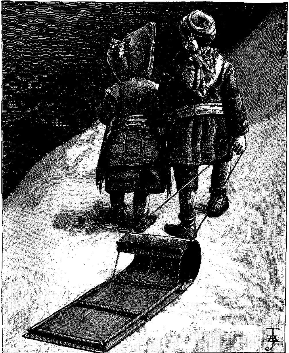
« Ἀνήφορος I »

έπάνω εις τὸ χιόνι, καθήμενοι εις ἑλκυ- θρα, ὁποῖα βλέπετε εις τὰς δύο προκε- μένας εἰκόνας. Τὰ ἑλκυθρα ταῦτα, ἅτινα λέγονται τοδόγανα , κατὰ πρῶτον ἦσαν ἐν χρῆσει μεταξὺ τῶν ἀγρίων Ἀμερικανῶν