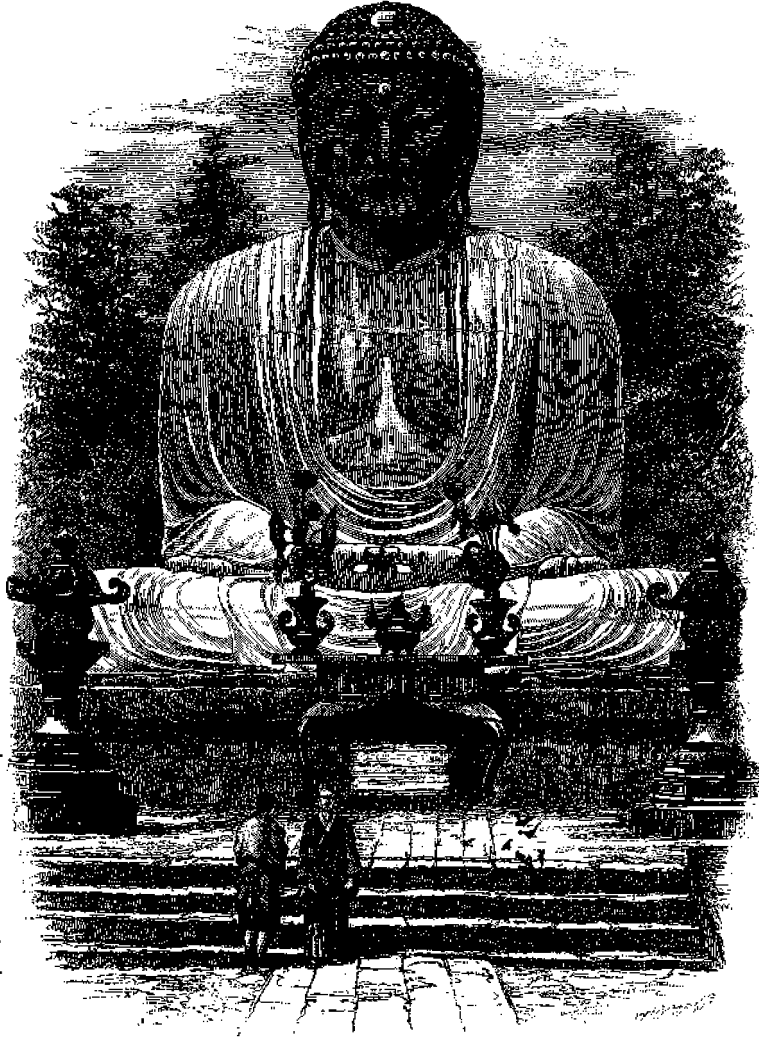
Ἄγαλμα παριστάνον τὸν Βούδαν.

— Ὅστις θέλη νὰ πράττη καλόν, εἰπέ τις ἀρχαῖος φιλόσοφος, πρέπει νὰ ἔχη ἢ φίλον πιστόν νὰ τὸν διδάσκη, καὶ εἶναι ἀληθέστατον! ἢ ἔχθρον τινα ἄγρυνον νὰ ἐὼν διορθῶνῃ!