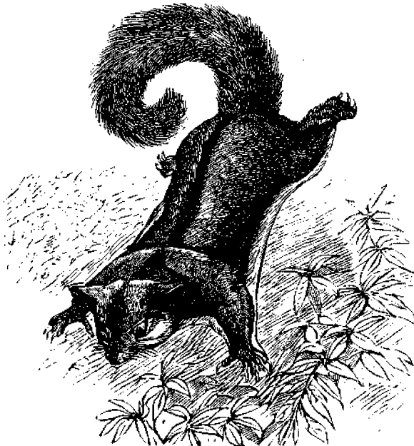
Οἱ πετώντες Σκιούρος.

Ἡ συνείδησις εἶχει τὴν δύναμιν νὰ ἐπαναφέρῃ τὰς λησμονηθείσας ἀμαρτίας μας. Τὰς ἀνασπάπτει ἐκ τῶν