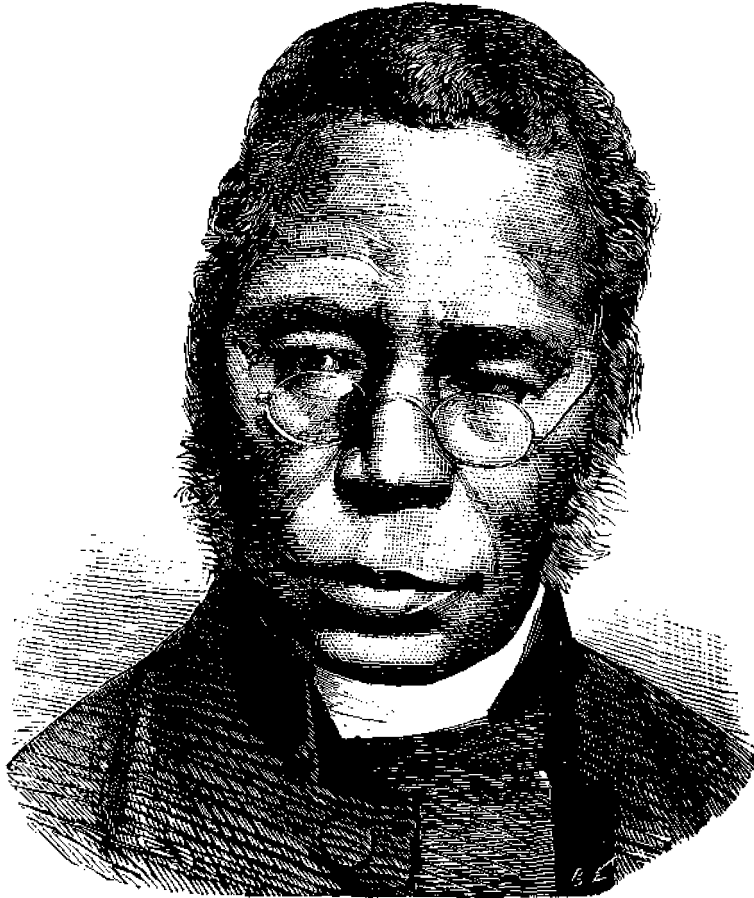
Ὁ ἐπίσκοπος Κρόθορ.

Μετὰ τοῦτο ἐστάλη εἰς Ἀγγλίαν ὅπου ἐσπού-