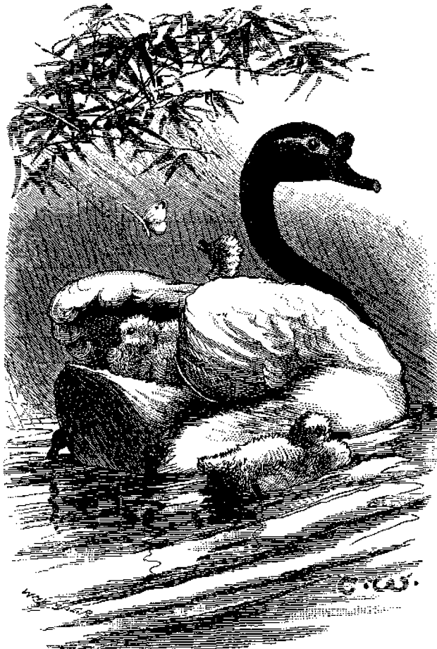
Πρωινή οἰκογενεακὴ ἐκδρομὴ.

Αἰγύπτῳ, ῥητῶς δὲ ἐκτίθεται ἐν αὐτῇ διὰ μέγα μέρος τῶν ἐμπορευμάτων ἐκείνων, ἅτινα εἶχον μεταφερθῆ διὰ παραβα- νίων, συνίστατο ἐκ κόνεως ἐκρηκτικῆς. Προσέτι, Ἀλέξαν- δρος ὁ Μέγας ἀπέριψε τὴν πρότασιν τῶν στρατηγῶν αὐτοῦ τοῦ νὰ προσβάλῃ λαὸν εἰνα ἐγγὺς τῆς Περσίας, διότι οὗ- τοι ἤδυναντο νὰ ἐκπέμψωσιν ἐκ τῶν ταίχων τῶν πόλεων των βροντὰς καὶ ἀστραπάς! Ἡ ἀλήθεια ὅμως εἶνε, ὅτι ἡ κανονο- κυρία, ὅπως ἐχομεν αὐτὴν ἡμεῖς σήμερον, δὲν ἦτο γνωστὴ πρὸ τοῦ 1220, οἱ δ' Ἄγγλοι δὲν ἐκαμαν χρῆσιν αὐτῆς εἰμὴ μετὰ 98 ἔτη εἰς τὴν μάχην τῆς Κρίου.