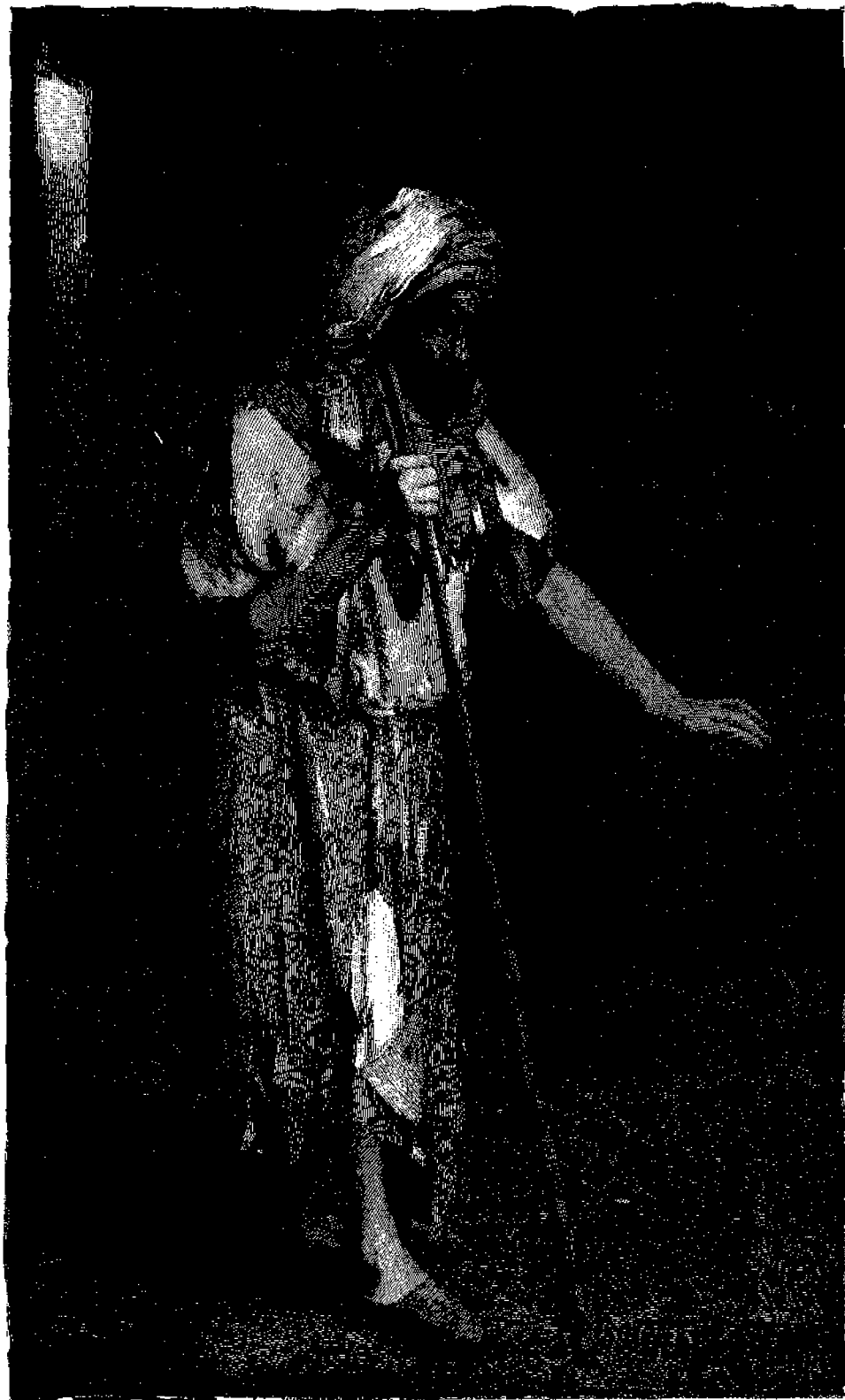
Ὁ τυφλὸς Βαρτέμαος.