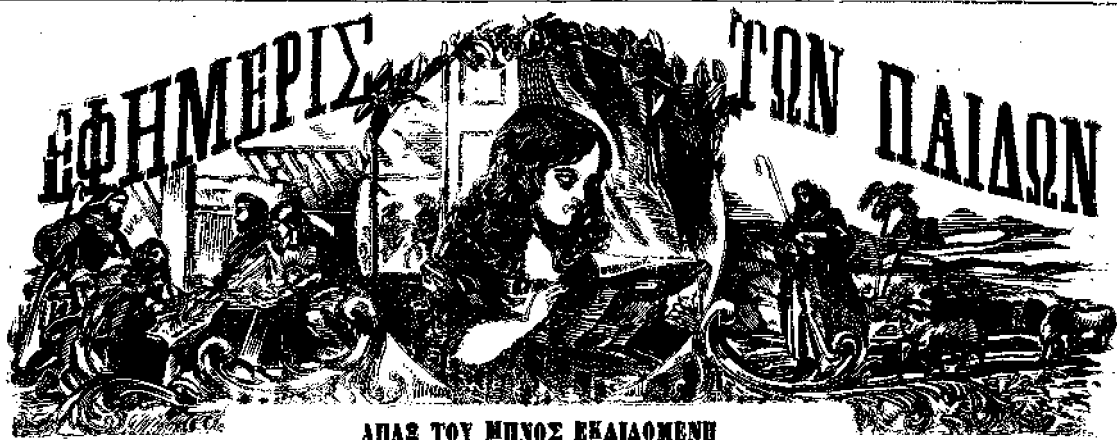
ΑΠΑΣ ΤΟΥ ΜΗΝΟΣ ΕΚΔΑΙΟΜΕΝΗ

ΕΤΟΣ ΚΕ. ΕΝ ΑΘΗΝΑΙΣ, ΣΕΠΤΕΜΒΡΙΟΣ. 1892. ΔΡΙΟ· 297