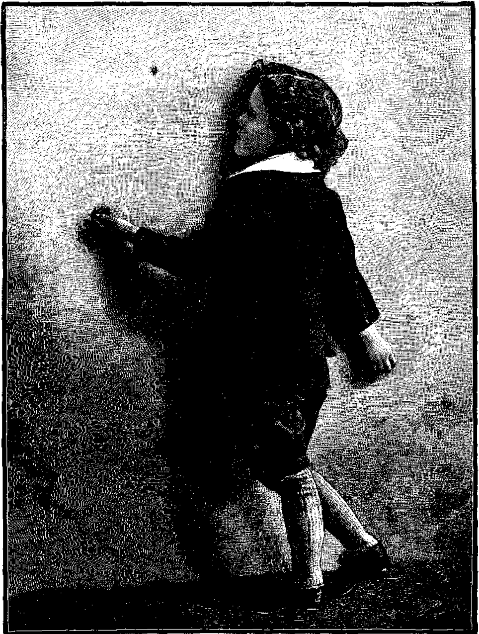
Ὁ Νικολάκης καὶ ἡ σφίρα

Διὰ νὰ ἰνοήσωμεν καλῶς τὸν ὑψηλὸν βαθμὸν