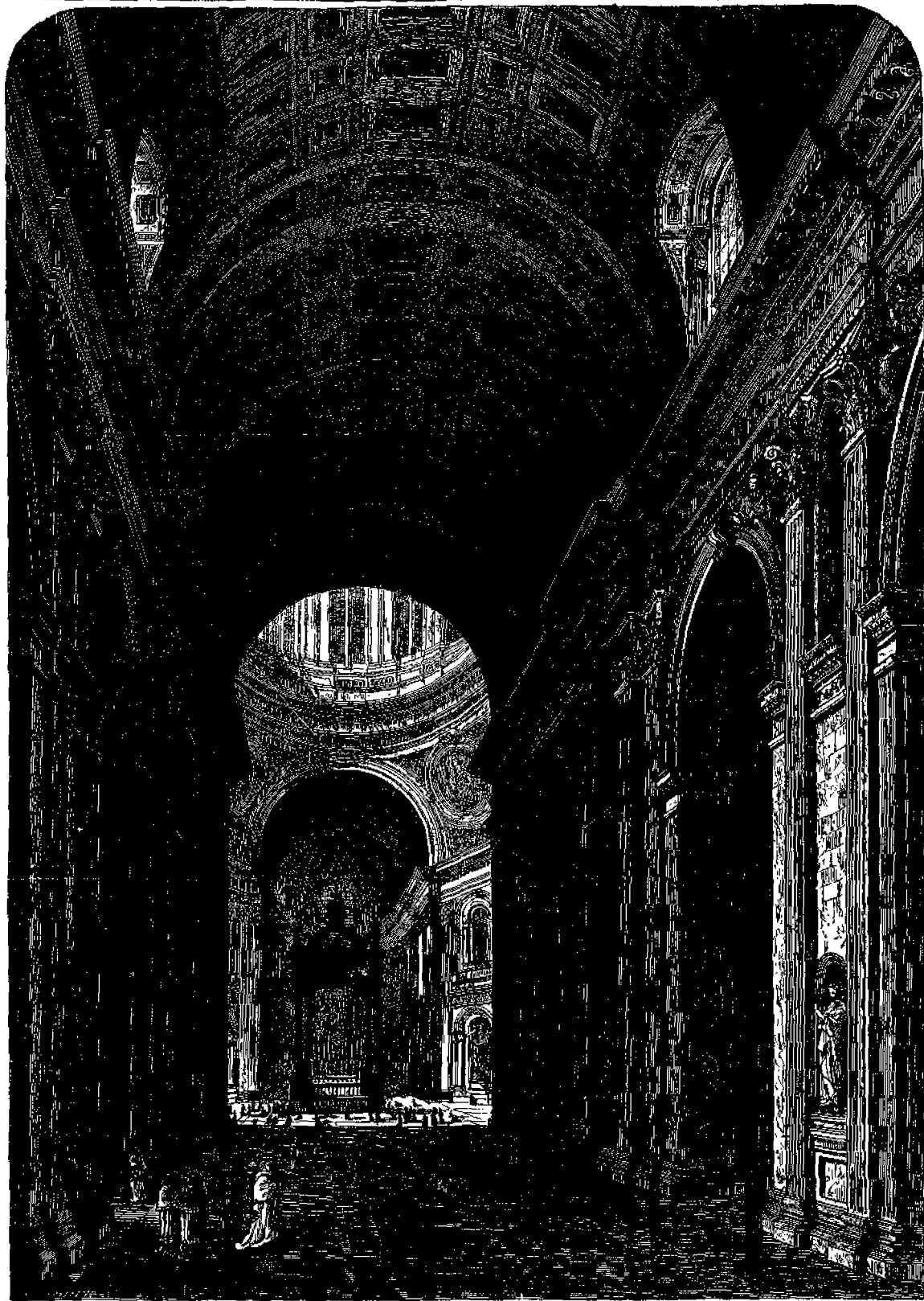
Ἐσωτερικὸν τοῦ ναοῦ τοῦ ἁγίου Πέτρου ἐν Ῥώμῃ.