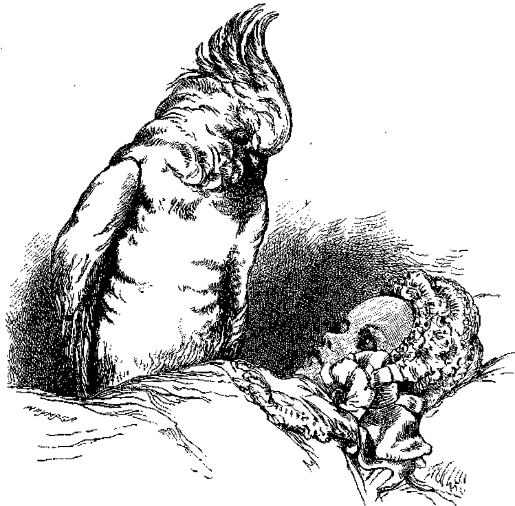
Η Κόκκατος και τό μωρόν.

στηθέν επί θρόνου μαρμαρίνου λευκού έργου του 13ου αιώνος. Τό άγαλμα τοϋτο μεταφέρθη εκεί υπό του Πάπα Παύλου του 5ου' εκ μοναστηρίου του Άγίου Μαρτίνου Τόση δέ είνε' ή έτησία συρροή και τοιοϋτος ο εϋσεβής προς τον Άγιον Πέτρον των πιτών σεβασμός, ώστε εκ των φιλημάτων αυτών ο μέγας δάκτυλος του δεξιού ποδός εξηφανίσθη σχεδόν. Η προκειμένη εικων παριτημ τό έσωτερικόν του εν λόγω ναού. Η εικων του άγάλματος του Άποστολου Πέτρου έδημοσιεύθη εις τό φύλλον του Νοεμβρίου 1891. Εις τό όποιον παραπέμπεται ο άναγνώστης.