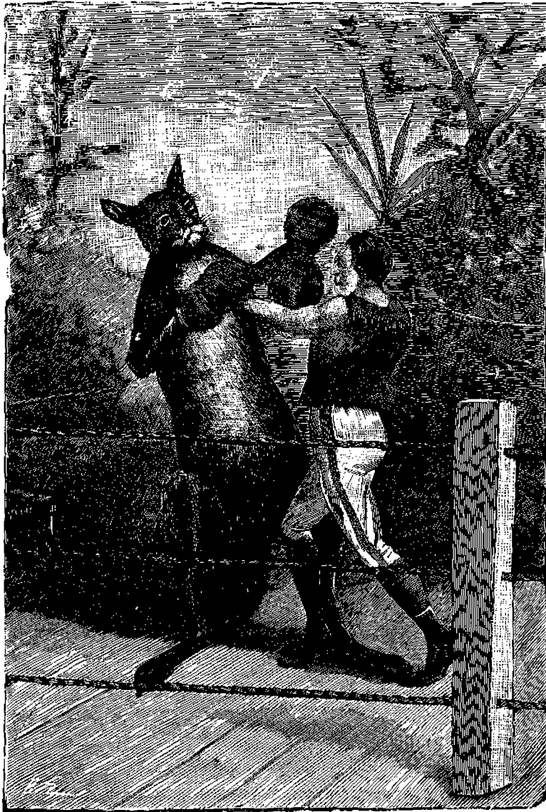
Καγγουροῦ Πυγμαχός. (Ἴδὲ ἐπομένην σελίδα.)

ὄψεων, λόφων, πεδιάδων καὶ κοιλάδων δὲν δύναται νὰ παράσχη εἰς ἡμᾶς τὴν ἰδέαν τοῦ ἀπέραντου τόσο, ὅσον ἡ θάλασσα. Ἐν τῷ μέσῳ αὐτῆς λαμβάνομεν κατὰ πρῶτον τὴν ἰδέαν τοῦ ἀπέραντου καὶ ἀρχίζομεν νὰ ἐννοῶμεν μικρὸν τι περὶ αὐτοῦ.