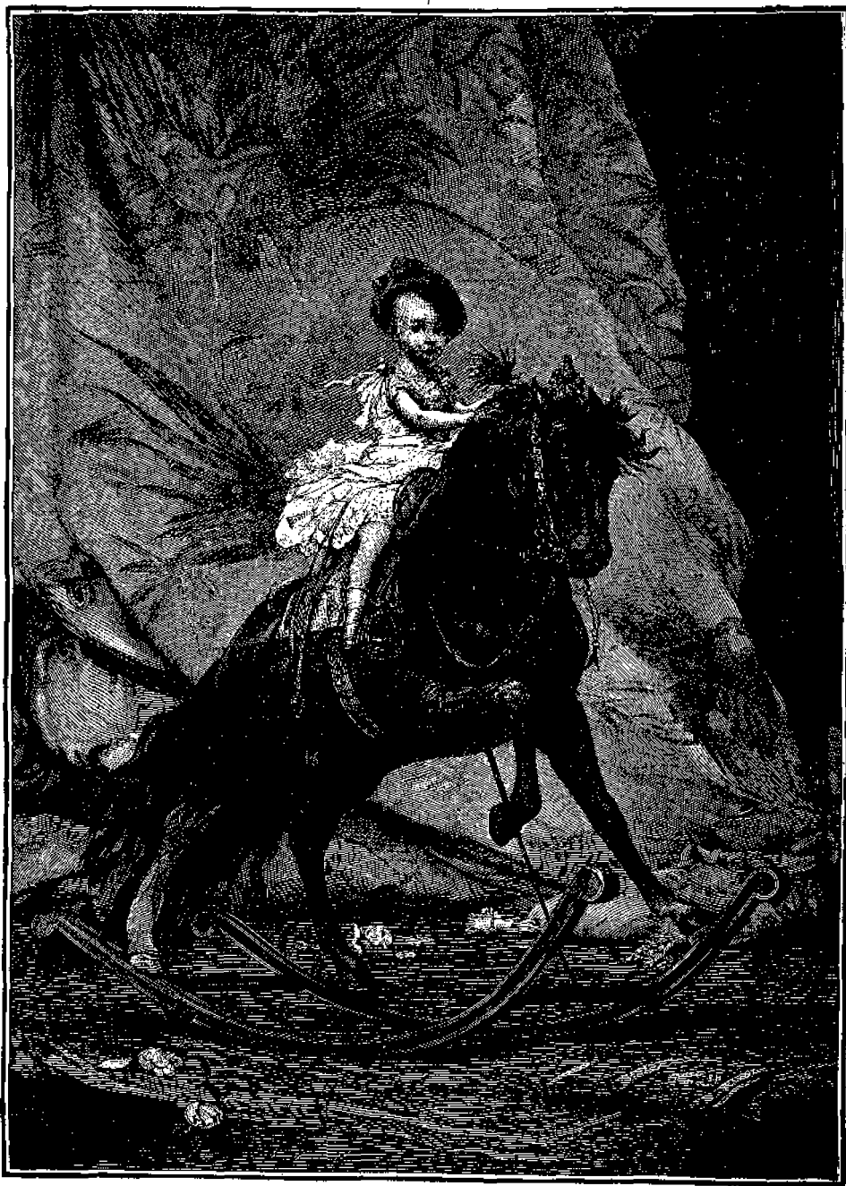
Ο βασιλεύς τῆς Ἰσπανίας Ἀλφόνσος.

μερίδος τῶν Παίδων βλέπουσιν εἰς τὴν προκει- μένην εἰκονογραφίαν, εἶναι υἱὸς τοῦ Βασιλέως Αλφόνσου υἱοῦ τῆς βασίλισσας Ἰσαβέλας τῆς Ισπανίας καὶ τῆς ἀρχιδουκίσσης τῆς Αὐστρίας Χριστίνης, γεννηθεὶς τὴν 17 Μαΐου 1886 ἑξήμισυας μετὰ τὸν θάνατον τοῦ πατρὸς αὐτοῦ Ἀλφόνσου ἀποθανόντος ἐκ φθίσεως, ὥστε ἤδη ἄγει τὸ 7 ἔτος τῆς ἡλικίας του. Καίπερ δὲ παιδίον εἰστί,