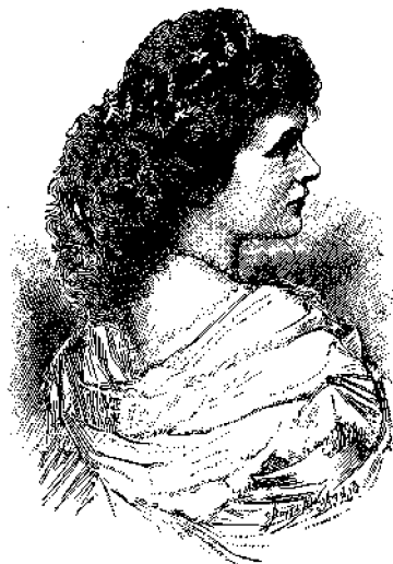
Ἡ βασίλισσα τῆς Ρουμωνίας Ἐλισάβετ.

Ἐπειδὴ δὲ ὁ Κύριος δὲν ἔδωκεν εἰς αὐτὴν ἄλλα τέκνα, πρὸς ἐξασφάλισιν τῆς διαδοχῆς εἰς τὸν θρόνον τῆς Ρουμωνίας,