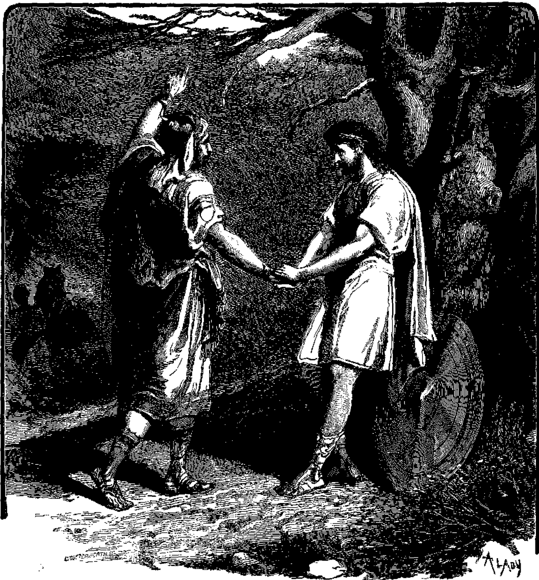
Ἐποχὴ ἀποχωρισμοῦ τοῦ Δαβὶδ καὶ τοῦ Ἰωνάθαν.

ώραν ακόμη' τόν δέ Βλύχερ είχε κατατροπώσει πρό δύο ημερών. 'Αλλ' ή ειρήνη και ή εύημερία της Ευρώπης αφήτει να πέση ο άκραιστος ουτος κατακτητής και αιμοδόρος στρατάρχης, να παύσουν δέ χιλιάδες άνθρωποι να σφάζωνται χάριν της φιλοδοξίας του, διό και ο Θεός τόν αφήκε να πέση, και έπισεν οικτρώς.