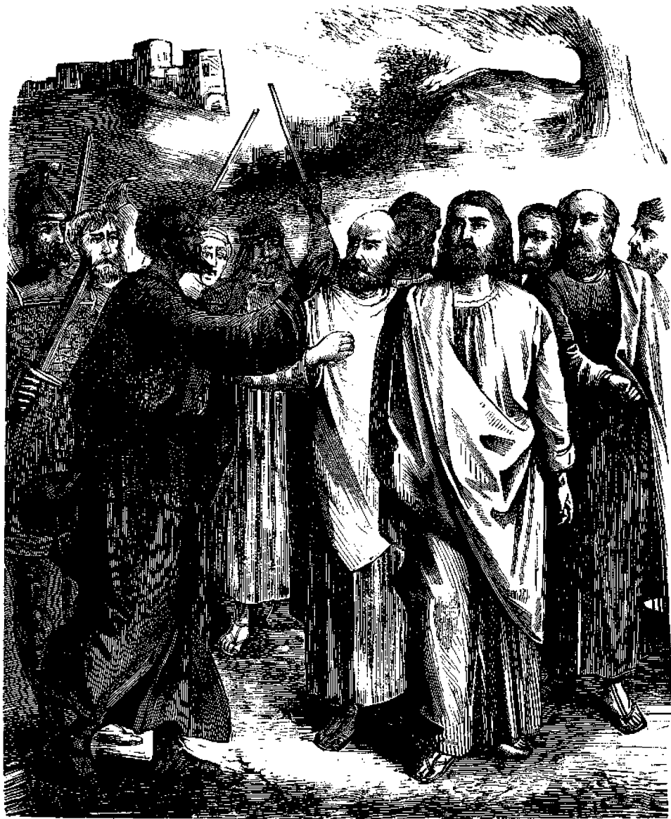
Ὁ Χριστὸς προδιδόμενος ὑπὸ τοῦ Ἰούδα.

χύθη, ζυγίζοντα 13,571 ὀκάδας καὶ κατασκευασθέντα ἐκ τοῦ μετάλλου τῶν Τουρκικῶν κανονίων, τὰ ὁποῖα ἐκυριεύθησαν κατὰ τὴν διάλυσιν τῆς μεγάλης πολιορκίας τῆς Βιέννης ὑπὸ τῶν Τούρκων κατὰ τὸ ἔτος 1683.