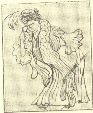
6.— 'Η Χονδροπελαγία άφ' ού ντύθηκε σίν κούκλα του καταστήματος Στάιν και αλοίφθηκε με όλα τὰ χρώματα της 'Ιριδος σπεύδει εις συνάντησιν του 'Αλέξανδρου.