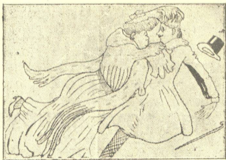
8.— Καί εις τὸν προθάλαμον της κ. Παπασταύρου πέφτει παρά πᾶσαν προσδοκίαν εις τὰς άγκάλας της . . . Πελαγίας Χονδροκάλφα. Είχε κάμει, ὁ δυστυχής, λάθος στὰς ἐπιγραφάς.