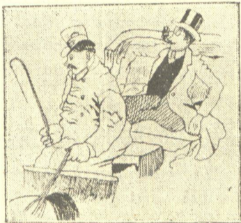
7.— 'Ο 'Αλέξανδρος εκράτησε τὸ ωραιότερον άμάξι της αγοράς και ώραιος ώς 'Αδωνης και υπερηφανος ώς Καίσαρ, σπεύδει εις συνάντησιν της ώραιάς του 'Ιουλίτσας.