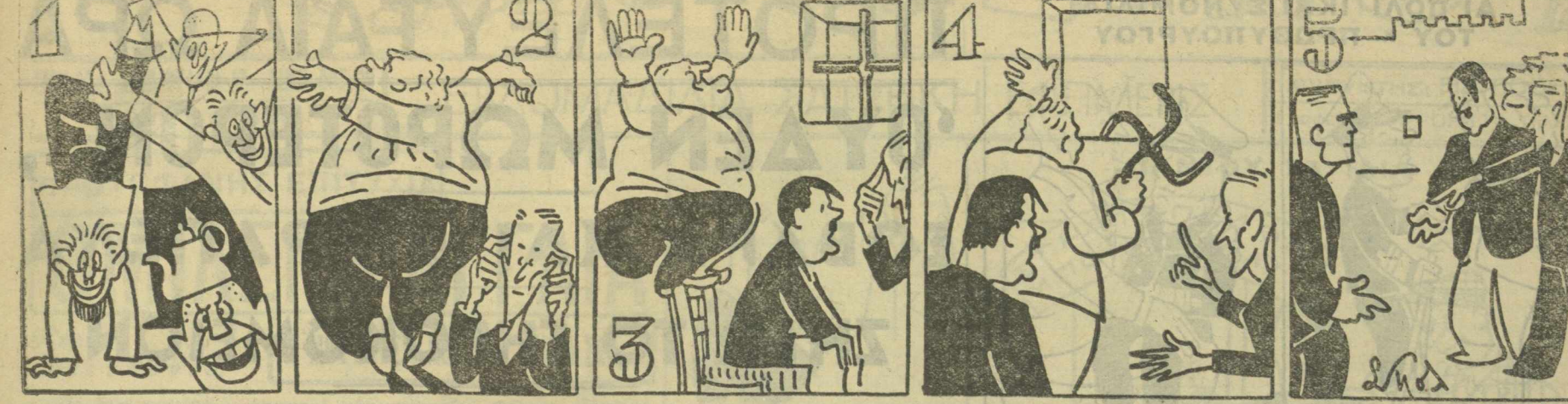
Η ΖΩΗ ΤΟΥ ΑΔΟΛΦΟΥ ΧΙΤΛΕΡ