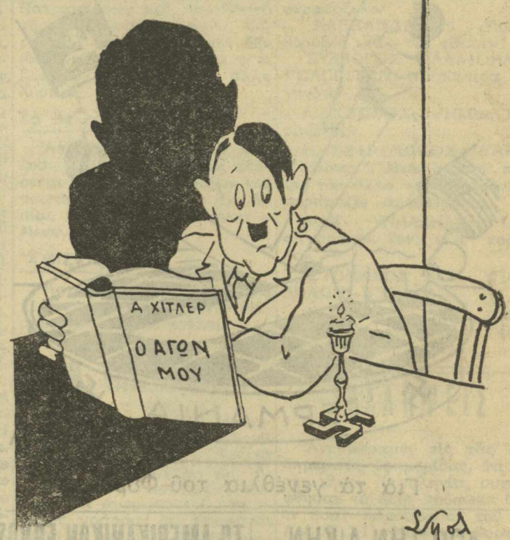
—Τὸ κερί κήκε καὶ μοῦ φαίνεται ὅτι δὲν θὰ προφτάσω νὰ τελειώσω τὸν Ἀγῶνα μου..