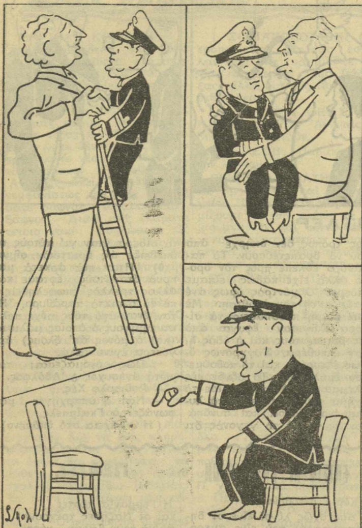
Ο κ. Βουλγαρης επισκέπτεται τον κ. Παπανδρέου, τον κ. Γονατάν και τον αρχηγόν του Λαϊκού Κόμματος.

Η πολιτική κατάσταση εμφανίζεται ως εξής: Έπειδή εσημειώθη απρυσμία του πολιτικού κόσμου προς συμμετοχήν εις την Κυβέρνησιν Βουλγαρη ο κ. Πρωθυπουργός ήναγκάσθη να αναθέσθι τα Υπουργεία εις καθηγητάς του Πανεπιστημίου καίτοι επικρατεί παρά τῷ λαῷ ἡ γνώμη ὅτι «οὐδέν ἐστὶ μωρότερον τῶν διδασκάλων»... Μάλιστα, ἐπειδὴ κατὰ τινὰς μωρότεροι καὶ τὸν διδασκάλων εἶνε οἱ ἰατροί, ἐγένετο ὑπουργὸς καὶ ὁ γνωστὸς χειρουργὸς κ. Σμαρούνης Τρίκορφος. Οὕτω ἡ Κυβέρνησις κατηρτίσθη ἀπὸ πολλὰς κορυφὰς καὶ ἓνα τρίκορφο. Μετὰ τὴν συμπλήρωσιν τῆς Κυβερνήσεως ὁ κ. Βουλγαρης ἀρχισε τὰς συνομιλίαις του μετὰ τῶν ἀρχηγῶν τῶν κομμάτων. Μετὰ τὰς ἐν λόγῳ συνομιλίαις—περὶ τῶν ὁποίων δημοσιεύομεν παραπλεύρως εἰδικὸ σκίτσο—τὸ πολιτικὸν γραφεῖο τοῦ κ. Πρωθυπουργοῦ ἐξέδωσεν τὸ ἐξῆς ἀνακοινωθέν: «Σία κι' ἀράξαμε». Ἄλλὰ δυστυχῶς δὲν ἀράξαμε. Ἐξακολουθοῦμε νὰ πλέωμεν εἰς τὸ πέλαγος τῶν συνευήσεων μετὰ τῶν κ. κ. πολιτικῶν ἀρχηγῶν, ἐνίοι τῶν ὁποίων ἐνεσφηνώσαν εἰς τὸν ἐγκέφαλον τοῦ κυβερνήτου τοῦ σκάφους κ. Βουλγαρη τὴν ἀντίληψιν, ὅτι ὁ ὑπηρεσιακὸς χαρακτήρ τῆς Κυβερνήσεως τοῦ ἐπιβάλλει νὰ μὴ λύσῃ οὐδὲν σοβαρὸ ζήτημα!.. Κατ' αὐτὸν τὸν τρόπον ἡ Κυβέρνησις θὰ ἀσχολῆται με εὐτράπελα καὶ κωμικά!.. Ἐπ' αὐτοῦ εἶνε σύμφωνοι οἱ κ. κ. Σοφούλης καὶ Καφαντάρης. Ἡμεῖς διαφωνοῦμεν. Ταῦτα περὶ τῆς Κυβερνήσεως.