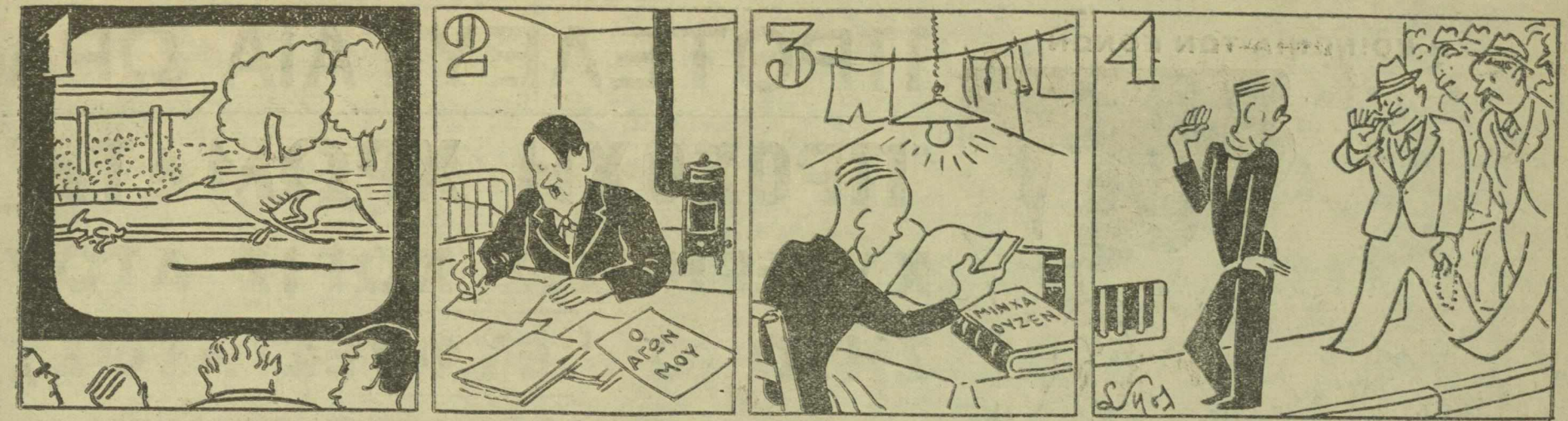
Η ΖΩΗ ΤΟΥ ΑΔΟΛΦΟΥ ΧΙΤΛΕΡ