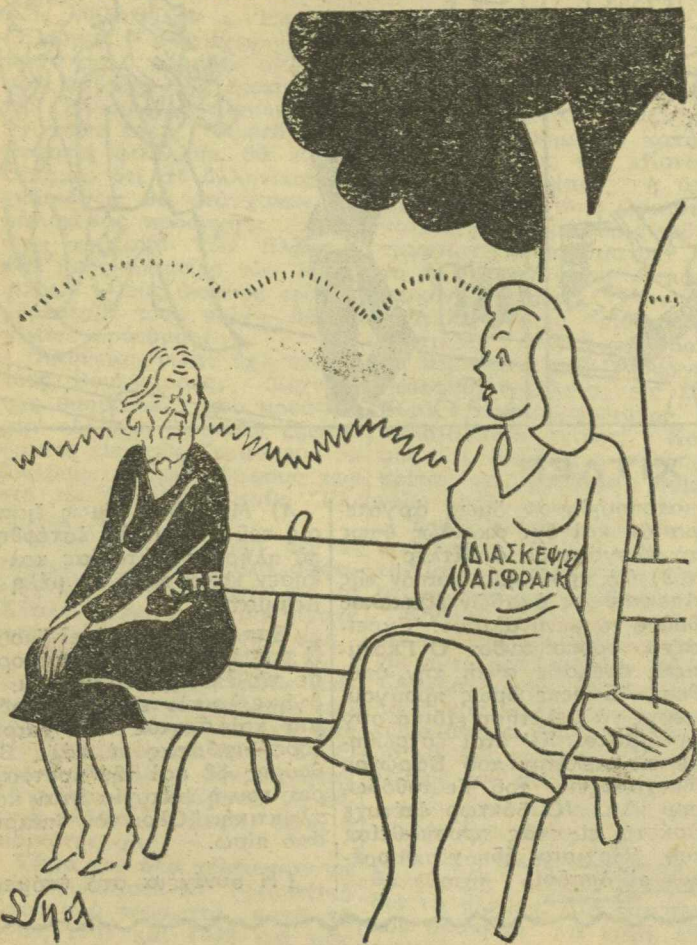
— Όλοι τους λένε ψέμματα και στο τέλος σ'έγκαταλείπουν...