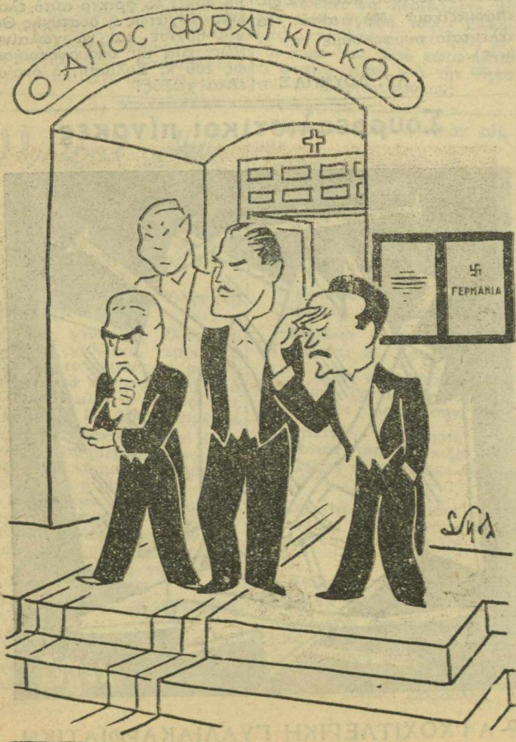
Έν ἀιαμονῇ τῆς ἐκφορᾶς...