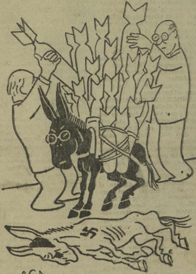
Ο ΧΙΡΟ-ΧΙΤΟ — Τώρα που ψόφησε ο άλλος όλα σε μένα τα φορτώνουνε...

Έλλάδι υπάρχοντες ελάχιστους φίλους μου; Ίδου μερικά: 1ον) Διατί ο κ. Πλαστήρας διαμαρτύρεται διά την σύνθεσιν του στρατού τόν όποιον αυτός... έστελέχωσεν; 2ον) Διατί ο Ναύαρχος Χατζηκυριάκος Ίδρους κόμμα «υπαξιωματικών και αξιωματικών»; 3ον) Διατί ο κ. Σοφιανόπουλος έψήφισεν κατά της Αργεντινης, έγκωμιάζων συγχρόνως την έλληναργεντινήν φιλίαν; 4ον) Διατί ο Μητροπολίτης Ιωαννίνων δέν παραπέμπεται ως δουλγος; 5ον) Διατί ο Θεός βασιλεύει τά κεραμίδια άν και είνε... ξεκάρφωτα; 6ον) Διατί ο κ. Αρμάνδος Δελαπατριδής θεωρείται τρελλός ενώ χιλιάδες άρχηγοί σοσιαλιστικών κομματιδίων δέν θεωρούνται; 7ον) Διατί είς τό σχέδιον άνοικοδομήσεως της χώρας δέν ελήφθη πρόνοια να κατασκευασθούν δέκα χιλιάδες... φρενοκομεία;