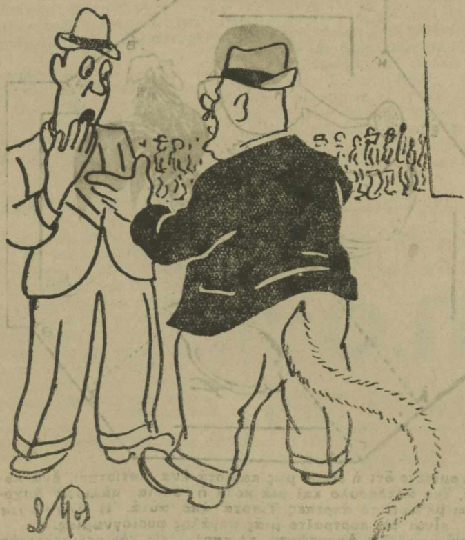
—“Όταν ήταν έγγυος σέ μένα ή μητέρα μου, τήν ήμέρα του ‘Αγ. Συμεών έπιασε ούρα στον μπακάλη.