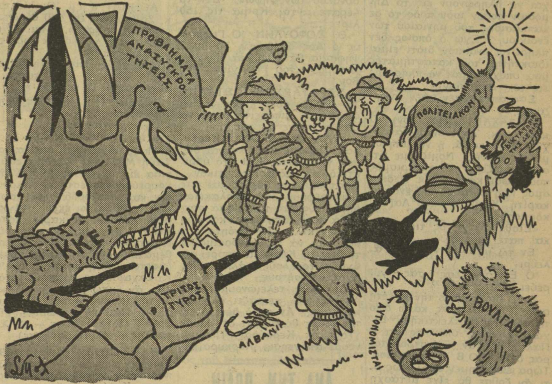
Συζητήσεις περὶ ὄνου σκιᾶς....

Υ.Γ. — Περὶ τῶν ἄλλων συμμάχων δὲν ὁμιλῶ, διότι δὲν εἶχαμε καμμιάν ἐταιρίαν μαζί τους. Ἀπλῶς ἐσυνηθίσαμε νὰ τοὺς ὀνομάζωμεν «συμμαχοὺς».