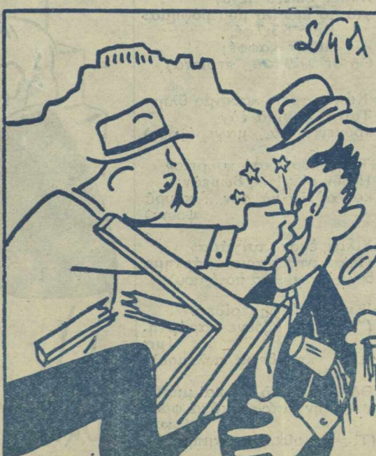
Οἱ Ἑλληνες πολίται καὶ αἱ ἀγγλικάι ἐκλογαί.