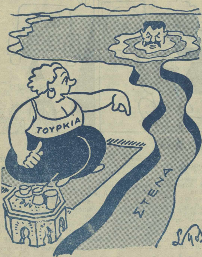
— Πρόσεξε γιατί εδώ είναι βαθειά...