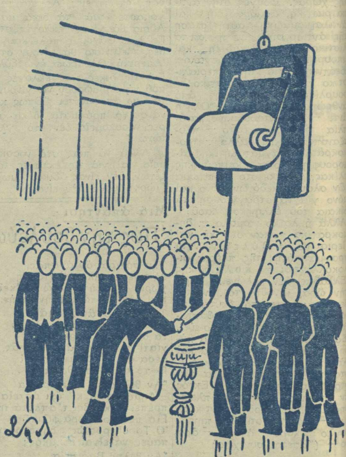
Ἡ ὑπογραφή τοῦ Χάρτου Διεθνούς Ἀσφαλείας