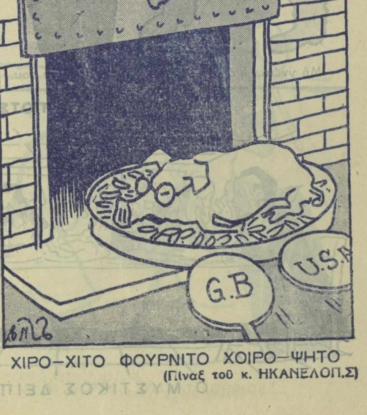
ΧΙΡΟ-ΧΙΤΟ ΦΟΥΡΝΙΧΟ ΧΟΙΡΟ-ΨΗΤΟ (Πίναξ του κ. ΗΚΑΝΕΛΟΠΣ)