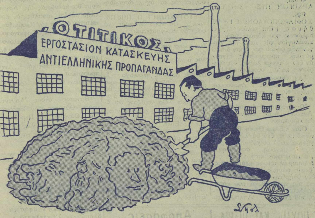
ΑΙ ΠΡΩΤΑΙ ΥΛΑΙ