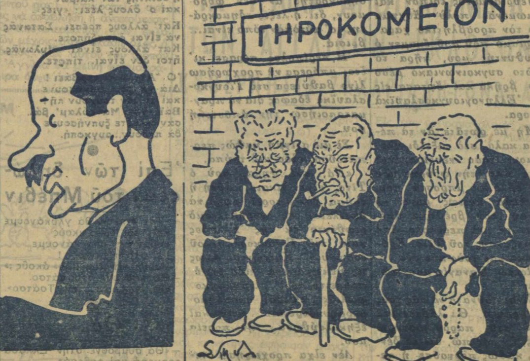
ΟΙ ΤΡΕΙΣ ΜΕΓΑΛΟΙ