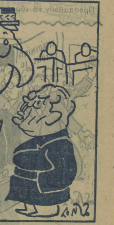
ΔΙΚΟΠΕΤΑΙΝΙΚΟΝ ΙΧΘΥΟΣΙΓΙΚΟΝ ΠΑΡΑΔΕΙΓΜΑ