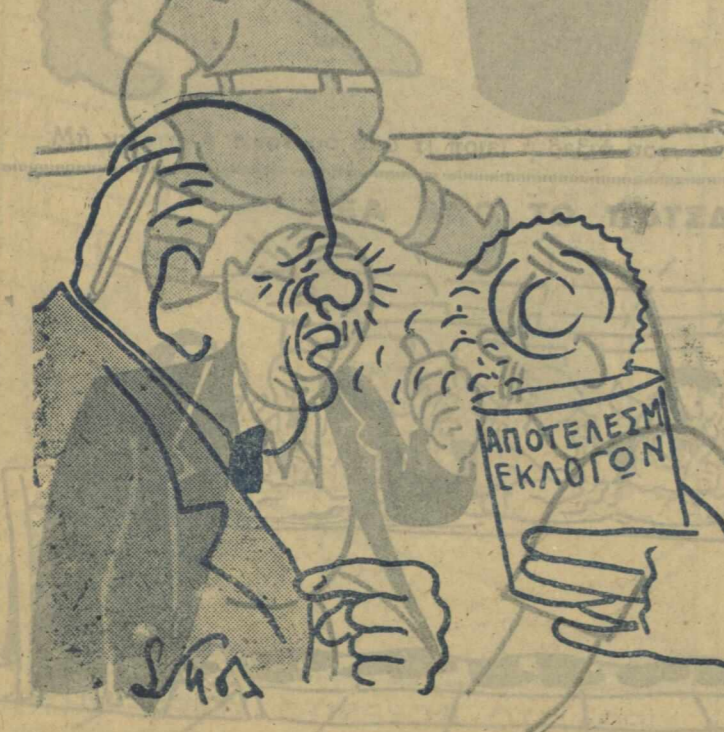
—Δική μου ήτανε... Είπε τή φησιγόμενη ερώτηση...