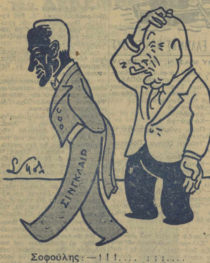
Σοφούλης: — !!!..... ; ; ;.....

Άνθρωποι όλοι τής Γης, πανηρώσате! Η Ειρήνη έσώθη!..