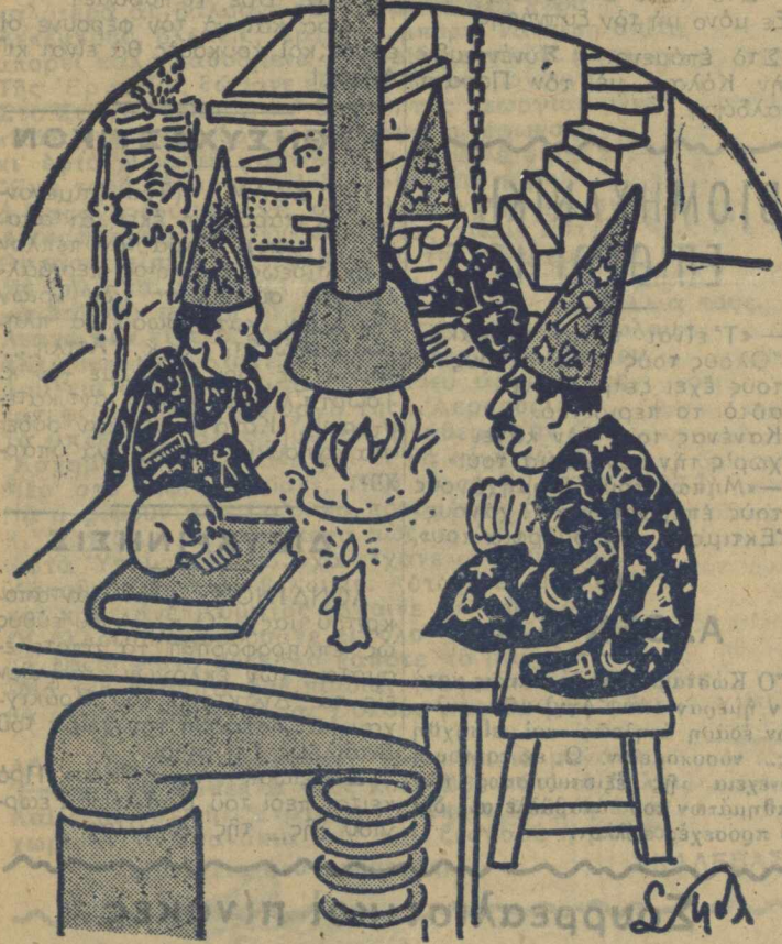
Προσπαθουν να ευρουν την... Αιωνιαν Ειρηνην (!!!)