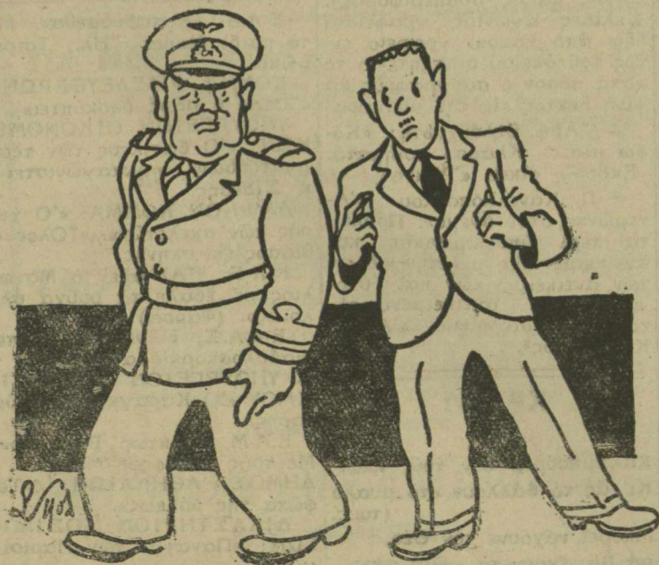
—Παίρνω ἕνα πρῶτο...