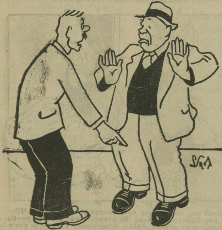
—Δύο δεξιά παπούτσια φορᾶς ; ! ... —Εἶμαι φιλήσυχος ἄνθρωπος...