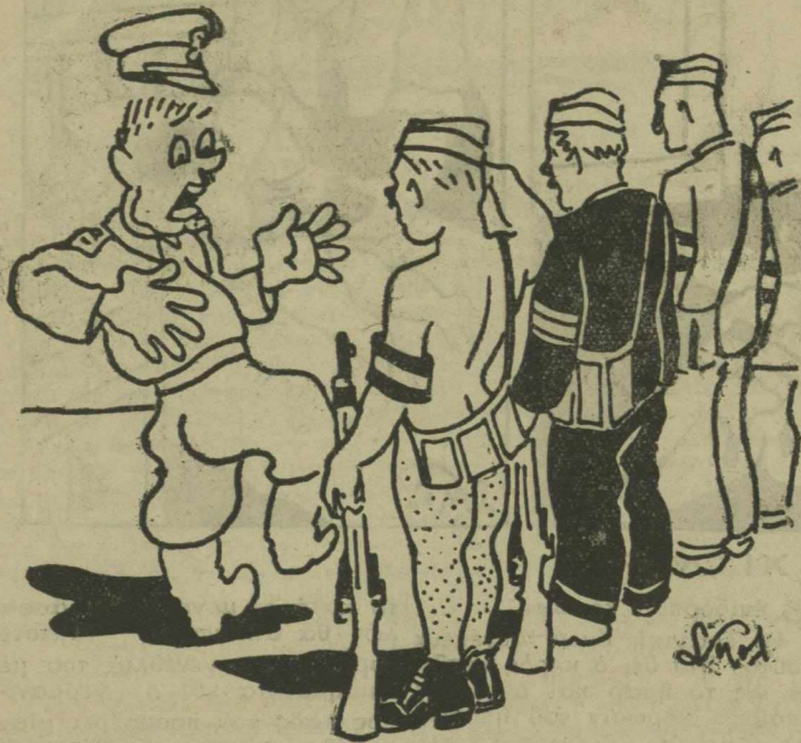
—Τά πολιτικά μου...ήτανε, κύριε Λοχαγέ και τά πούλησα...