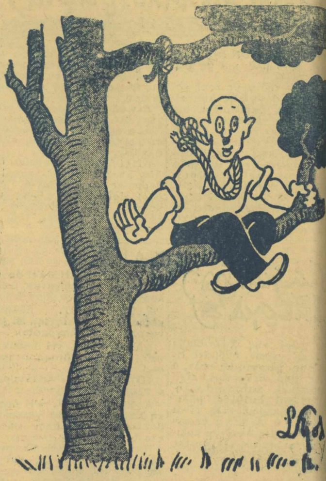
— Βρέ, γιὰ κῦττα, νὰ μὴν ἔχω λίγο σαποῦνι.

Μετὰ τὴν Σοφιανοπούλιον αὐτὴ προοπτικὴ εἴμεθα βέβαιοι ὅτι ἡ συνδιόσκεψις τῶν Πέντε θὰ ἐγῆ... εὐτυχῆ ἀποτελέσματα.