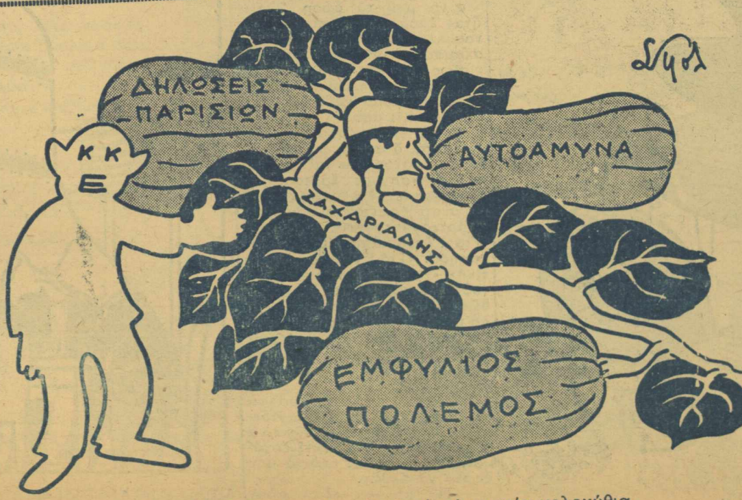
Κ.Κ.Ε. — Ἐχὼ μιά κολοκυθία πού κάνει τρία κολοκύθια.