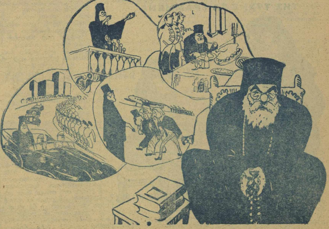
— «Βαρεία ναι ή... Καλογερική»