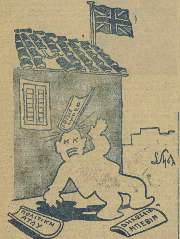
Και ή τρίτη κεραμίδα

Είναι ντροπή μας νά λεγόμεθα Έλληνες. Αίσχος.