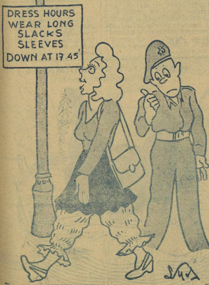
Νά φοράτε μακρυά πανταλόνια και να κατεβάσετε τās μανίκια στās 17.45'