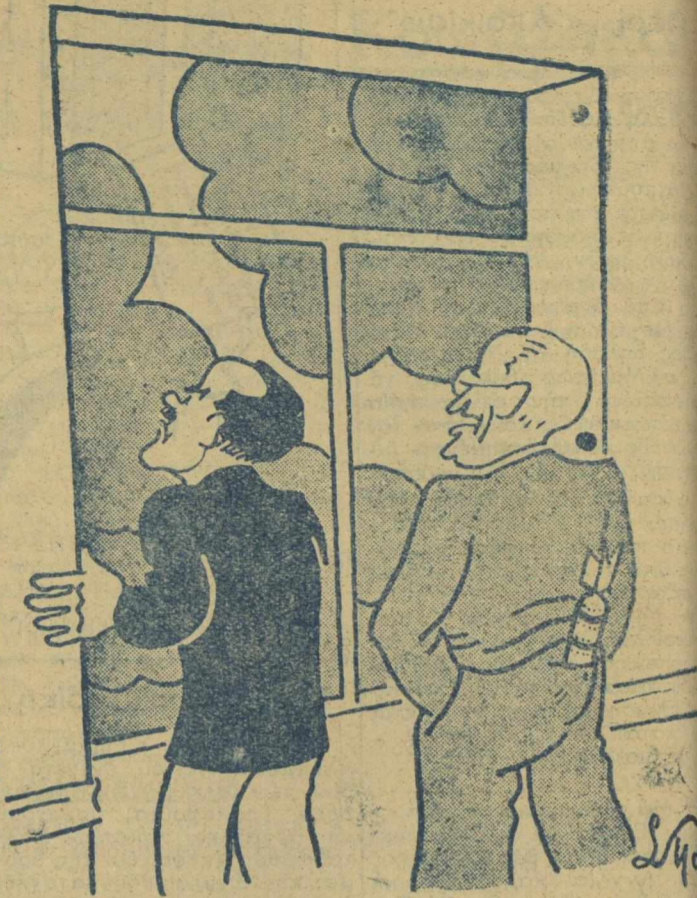
ΜΟΛΟΤΩΦ: Χαλάει ό καιρός. ΤΡΟΥΜΑΝ: Καί δέν έχομε την όμπρέλλα του Τσάμπερλαιν...