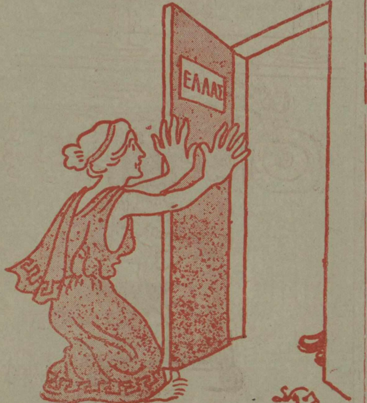
—Τί θέλετε, Κύριε, τὰ Δωδεκάνησα; Πάρτε πρὸς τὸ παρὸν Δέκα καὶ σὰς ὀφειλῶ δύο.....