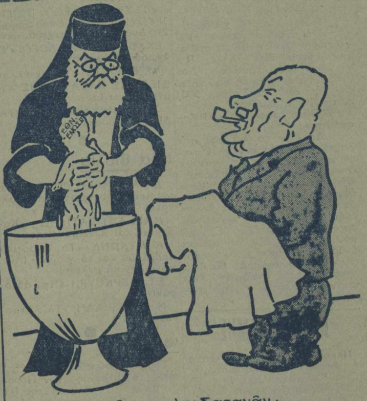
—Άπετάξασο τόν Σατανάν; —Θα σκεφθώ.....

Ίδου μιά σκέψις... «λογική»: —«Άφοϋ 'σθε περισσότεροι γιατί δέν προτιμάτε τήν... αναλογική;» Διαβάζετε, σκεπιάσαστε κι' είτα... λιποθυμάτε. Και παρετήρουν μερικοί! —«Η Κύρκειος» ή λογική των άνωτέρω, δζει όλίγον... Καραγκιόζη: «Άφοϋ δέν μοιάζω για παλλη- γιατί κύρ Βεληγκέα... καράς με βα- λρας.»