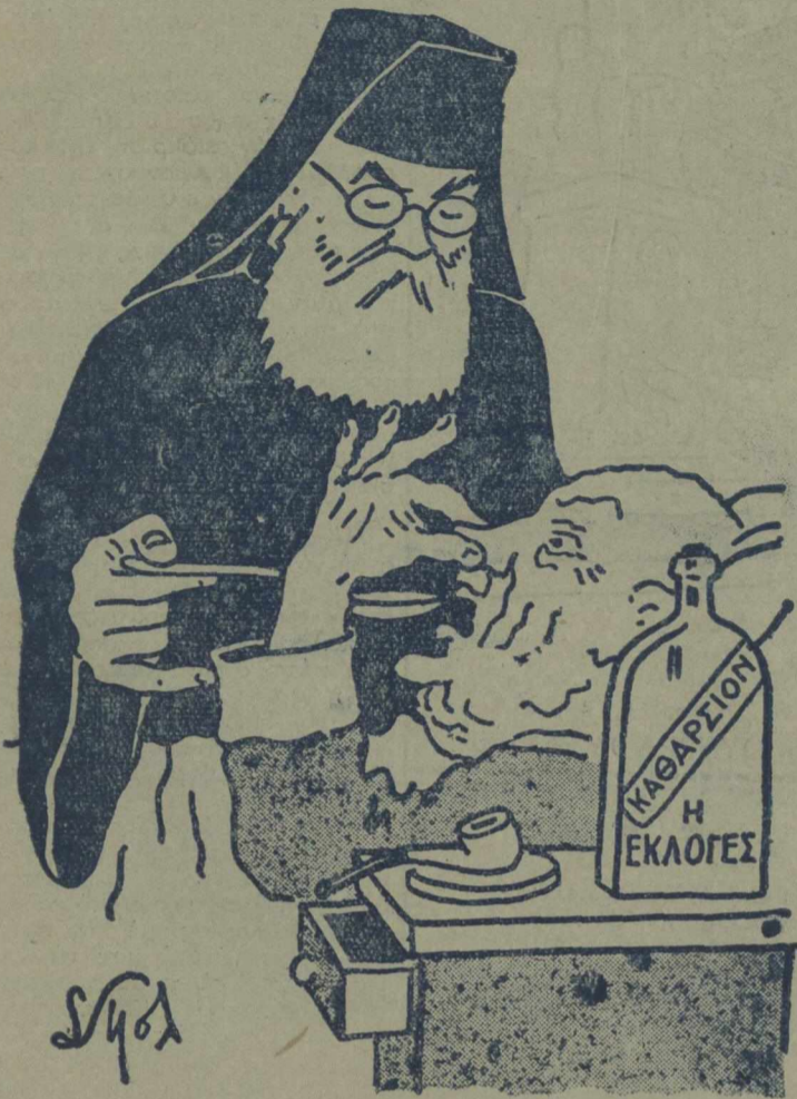
—Πρέπει να τῶ πάρης —Μά..... θα βγω;

ΔΕΝ ΠΡΟΚΕΙΤΑΙ ΠΕΡΙ ΜΕΤΑΛΗΨΕΩΣ ΤΟΥ Κ. ΣΟΦΟΥΛΗ (Πρός πρόληψιν παρεξηγήσεως)