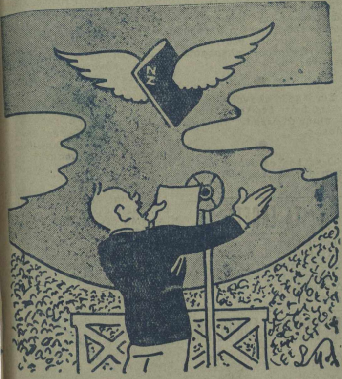
Και το Πορτοφόλιον έν είδει περισσότερας έβεβαίου του λόγου το άσφαλές.