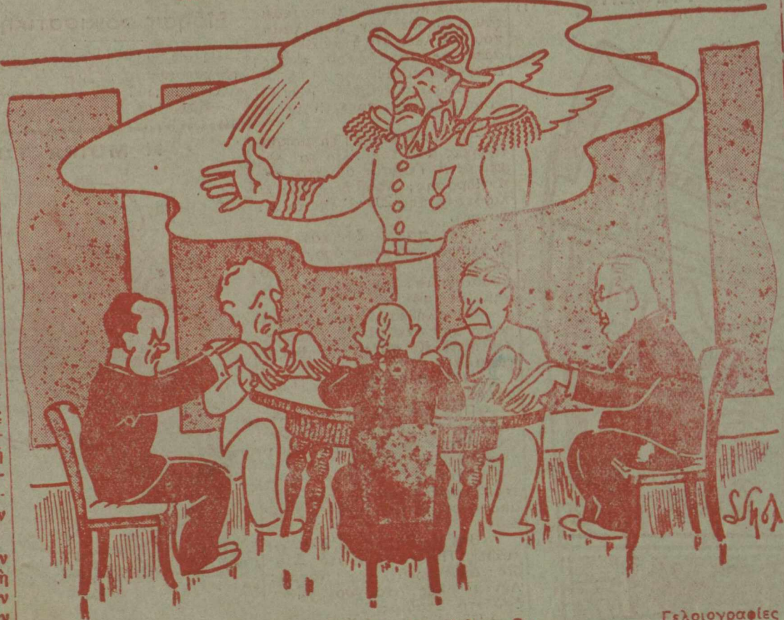
—Συ είσαι Πνεϋμα της Συνδιαλλαγής; —Όχι. Είμαι τό Πνεϋμα του Καμπρών.