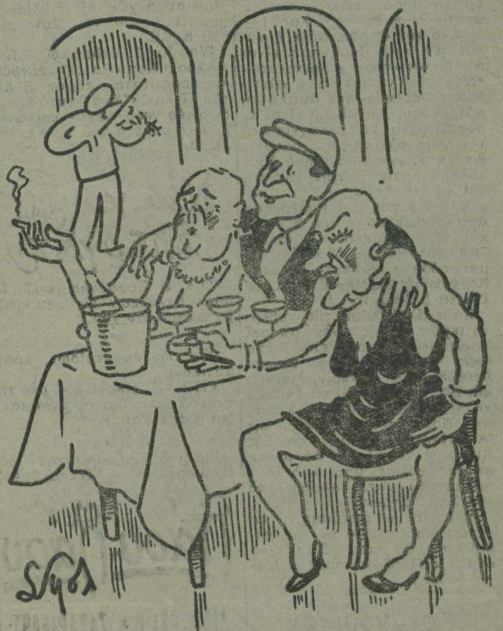
Τὸ... «ΚΕΝΤΡΟΝ»! (Γελοιογραφίες: Σ. ΠΟΛΕΝΑΚΗ)