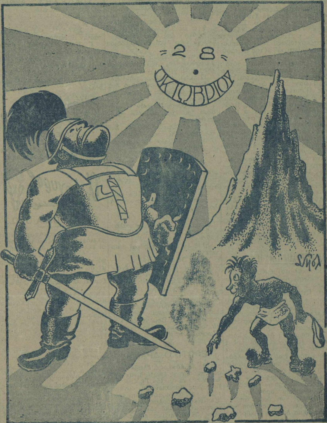
Δαυὶδ και Γολιάθ