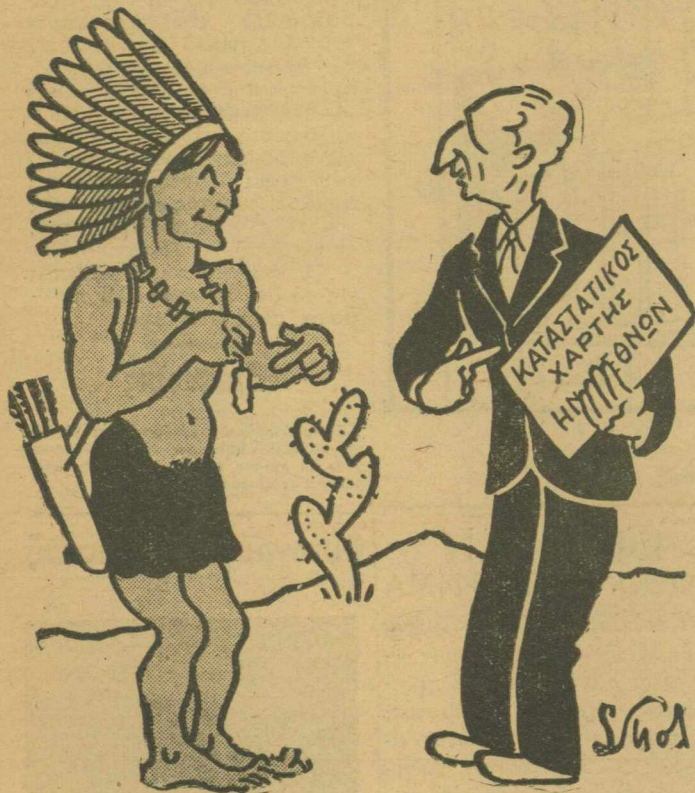
— 'Ο 'Ερυθρόδερμος: — Τό δικό μου φυλακτό είνε καλύτερο! "Οποιος τώχει, δέν πεθαίνει ποτέ..."

Μετά τας δηλώσεις Τρούμαν : ΑΠΟ ΤΗΣ ΠΑΡΕΛΘΟΥΣΗΣ ΕΒΔΟΜΑΔΟΣ Ο ΠΟΛΕΜΟΣ...ΚΑΤΗΓΗΘΗ (111)