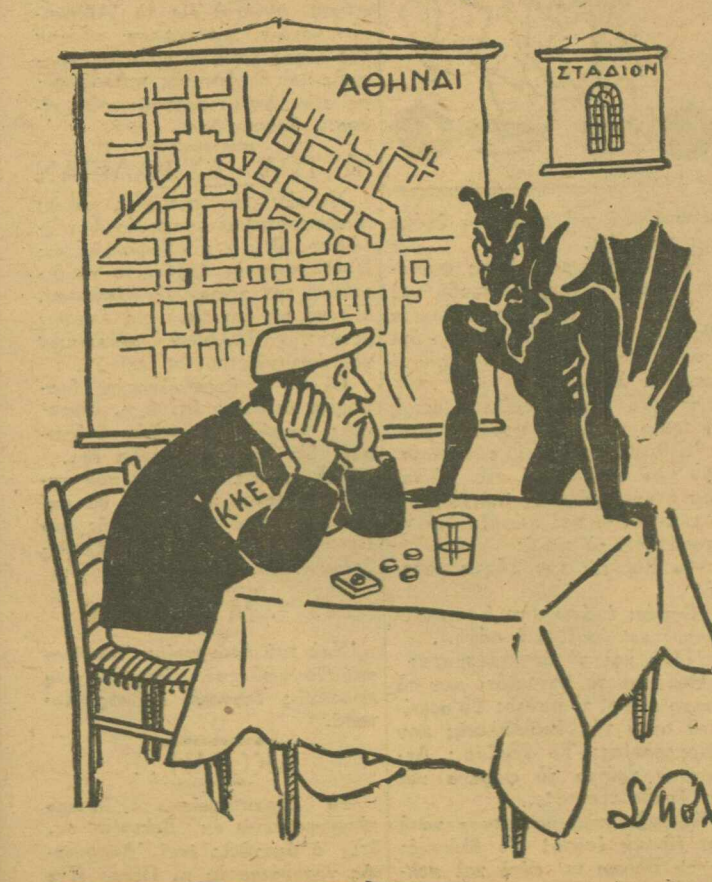
ΣΧΑΡΙΑΔΗΣ: Έσόν πάλι μ' έβαλες να κηρύξω τήν άποχή από τήν έορτή...