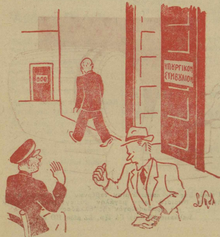
—Μήπως άποχωρεί πάλιν τής Κυβερνήσεως ό κ. Π. Ράλλης; | "Όχι... Πηγαίνει εις τó άποχ. ....