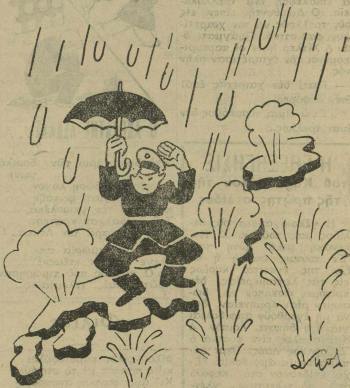
Ό Χίρο-Χίτο: «Καί μή χειρο-χειρότερα...»