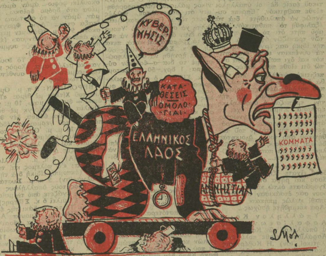
Ο ΚΑΡΝΑΒΑΛΟΣ ΤΟΥ 1945

δήλωσε προχθές ότι «δεν θέλει μιμπελό ζά το γάλα του, άλ- λά θέλει τσηφο ζά να μαυλίση τους δεισιούψ». Είχατε πάντοτε αυτή την συ- νήθεια ή την άποκτήσατε τώ- ρα με τον πόλεμο; Εάν και πρότερον συνέβαινε το ίδιο, τότε ποιοι εργάζονται διά να σας τρέφουν; Άποικίας δεν έ- χετε και ή πατρίδα σας είναι πλουσία μόνον εις δόξαν. Κα- τά συνέπειαν πώς τα βολεύε- τε; Τώρα βέβαια επειδή ό στό- μαχός σας έχει προπονηθή ά- πό τους Γερμανούς, εύρισκете άρκετά τὰ ελάχιστα τρώφιμα που σας δίδουμε. Άλλά πρό- πολεμικώς πώς ζούσατε; Ποί- ος σας έδιδε το καθημερινό σας μπέικον; Ποιος εφρόντιζε διά το βούτυρό σας; Ποιος διά την μαρμελάδα σας; Ποιος ά- νελάμβανε τὰ έξοδα της θερ- νής σας μεταβάσεως εις την έξοχήν; Διότι δεν μπορώ να φαντα- σθώ ότι ζούσατε δίχως μπέι- κον, βούτυρο, μαρμελάδα και έξοχή. Μιά τέτοια ζωή θα ήτο τελειώς άνυπόφορος δι' ένα λα- όν σαν τον δικό σας ό όπου ως έξηκρίθωσα άποτελείται ά- πό... τζέντλεμαν. Θά είχατε την καλωσύνη, κ. Διευθυντά, να μου άποκαλύ- ψετε την μέθοδον διά της οποί- ας τὰ καταφέρνετε; ΤΟΜ ΟΥ'Ι-ΛΣΩΝ Άπάντησις: Σας άπαντώμεν: Άπλού- στατα ζούμε και έξούσαμε δί- χως μπέικον, μαρμελάδα, βού- τυρο και έξοχή διότι με ό,τι και αν κάνωμε ό τόπος αυτός δεν μπορεί να μάς δώση μπέι- κον, μαρμελάδα, βούτυρο και έξοχή. Ζώμεν και έξούσαμε και επειδή είμαστε και... τζέν- τλεμαν όταν είδαμε πώς δεν μπορούμε να τρώμε τίποτε άλ- λο... τρώμε... πολιτική.