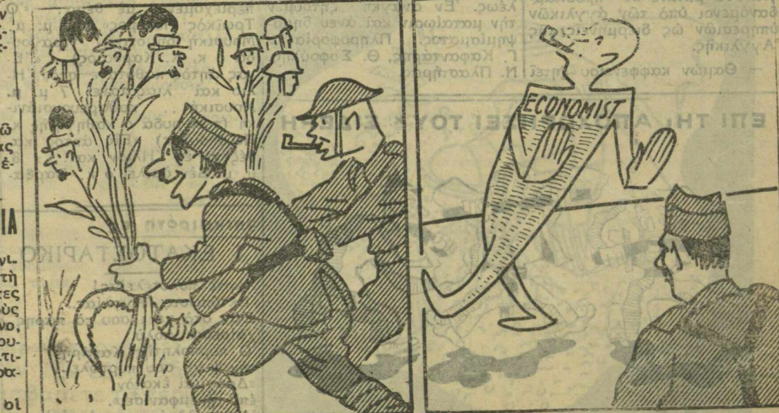
Όταν θερίζουμε μαζί: «Βασίλη, κύρ - Βασίλη» Τώρα πού άποθερίσαμε: «Πού σ' είδα βρέ κασίδη!»