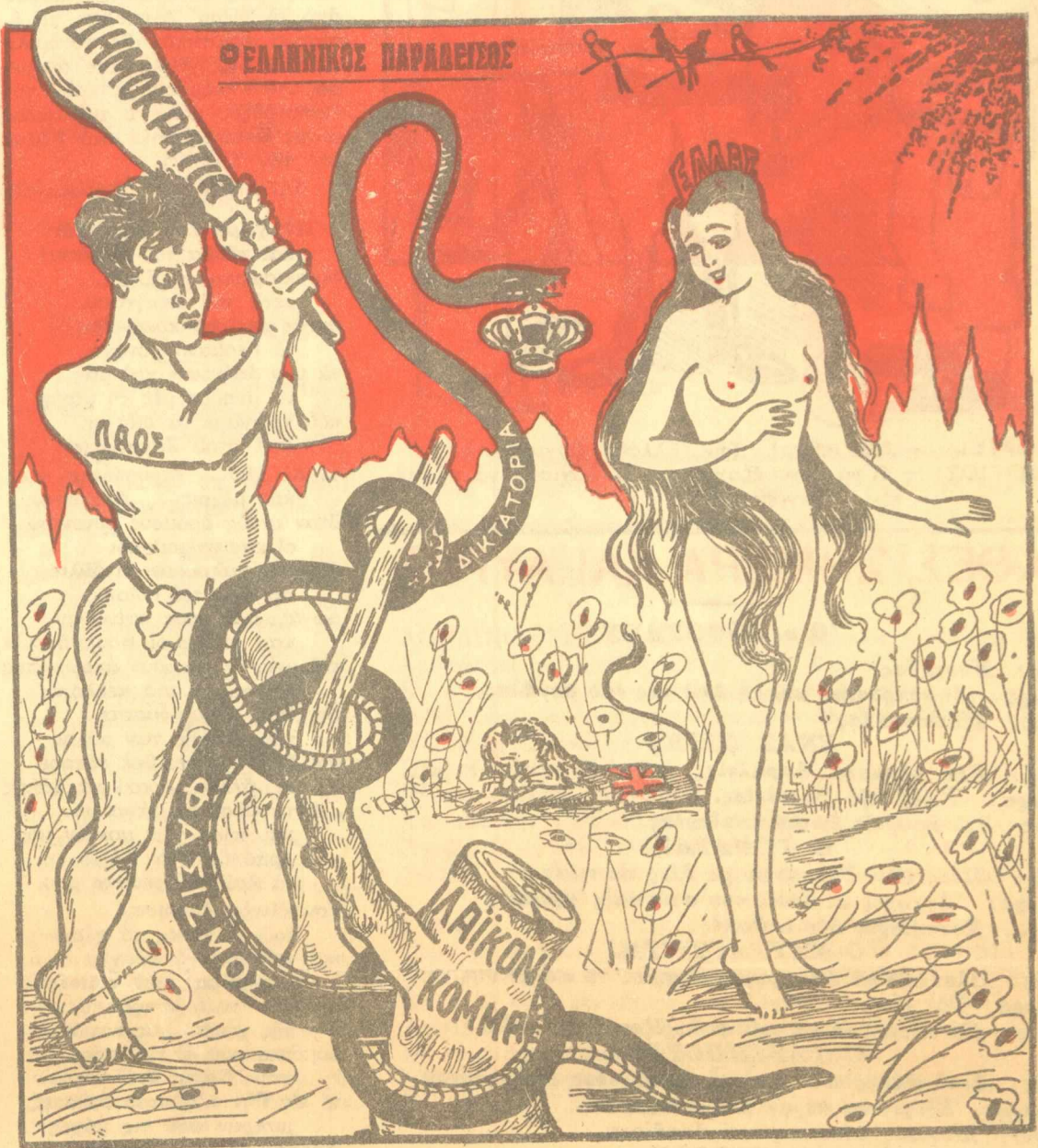
Η ΕΥΑ, ο πονηρός ΟΦΙΣ με τον άπηγορευμένο καρπό και ο Λ'ΑΔΑΜ με τό... έξύλο της γνώσεως.

— Πλήρης άτομική έλευθερία!... Νά σέ φιλήσω, Χρυσότομε!... Η ΛΑΧΑΝΙΔΑ