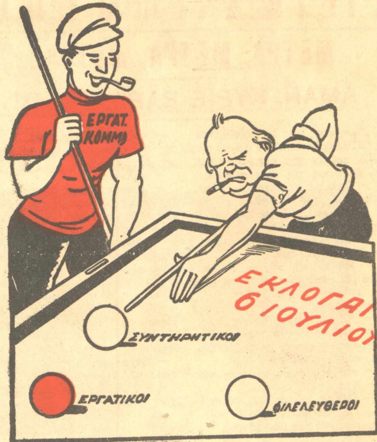
Ὅπου ὁ Τσῶρτσιλ τὴ θρίσκει σκουῖρα στὴν τελευταία καραμπόλα