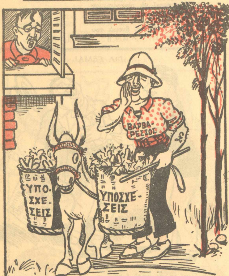
Ο ΔΗΜ. ΥΠΑΜΗΛΟΣ. — Αί, μανάθη, τί πουλάς σήμερα; Ο ΜΑΝΑΒΗΣ. — Όπως πάντα... κ ο λ ο κ ύ θ ι α!