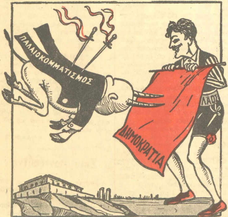
Ο άτρομητος τορεαντόρ παίζει με τον λυσσασμένο ταύρο.