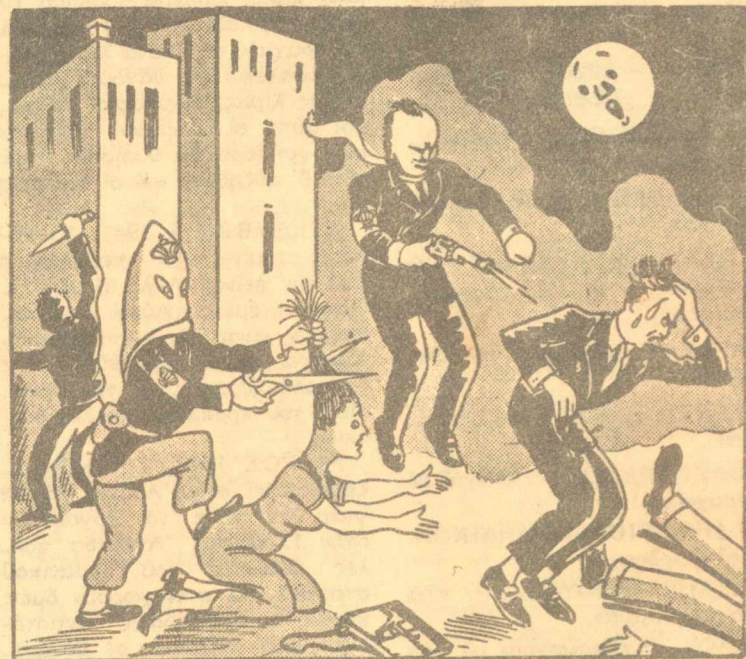
ΤΟ ΥΠΟΥΡΓΕΙΟΝ ΕΣΩΤΕΡΙΚΩΝ ΔΙΑΝΥΚΤΕΡΕΥΕΙ!..