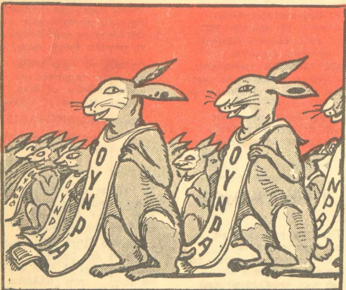
ΤΙ ΜΑΣ ΤΑΖΕΙ ΚΑΘΕ ΤΟΣΟ ΤΟ ΥΠΟΥΡΓΕΙΟΝ ΑΝΕΦΟΔΙΑΣΜΟΥ

τ'ό Κρεμλίνον με τ'α κιόλια. Καίτοι τ'όχανε στο μάτι και τ'όυ τρέχανε τ'α αάλια. Μά ο Θεός τ'όυς τ'ό είπε: Δέν θά μπήτε στο Κρεμλίνον Γιατί θάρθουνε οι Ρώσοι γλήγορα στο Βερολίνο! Μέσ' στο γιορτασμό της Νίκης θ' άκουστονε παλαμάκια άπ' τ'ό Τσώρτσιλ κι' άπ' τ'ό Τρούμαν για τ'ό Θείου τ'α μούστακία. Ο ΡΩΜΗΟΣ