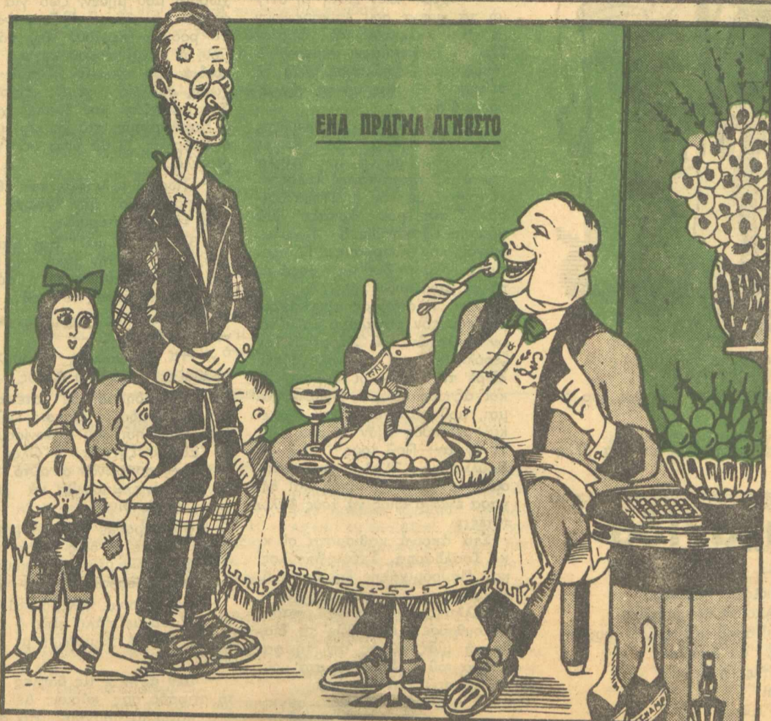
Ο ΑΠΟΛΥΘΕΙΣ ΥΠΑΛΛΗΛΟΣ: "Έλεος 'Εξοχώτατε, θά πεθάνουμε από την πείνα! ΒΑΡΒΑΡΕΣΣΟΣ: "Από την πείνα; Δέ σέ καταλαβαίνω τί λές. Τί πράγμα πάλι είναι αυτή ή πείνα;

Παράλληλος υπό του διαση- μου 'Ελληνοσ 'Ιατρού κ. Τραμ- πούκου, άνεκοινώθη ή εφεύρεσις των φαρμάκων: Μαγγουρίνη, Ροκαλίνη, Κλαμπίνη έφάμιλλος της Πεν-Ξυλίνης!