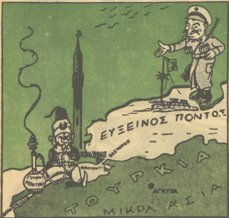
ΣΤΑΛΙΝ: Αί, γείτονα, δέν τ' άνοίγουμε λιγάκι γιά νά περνά και κανείς άλλος;