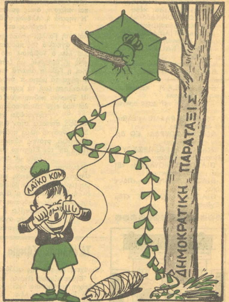
«Του άητού ό γιυός πάει κι' αυτός!...»