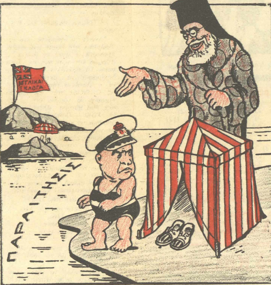
ΑΝΤΙΒΑΣΙΛΕΥΣ: Πετράκη... πῆ ε ε πρῶτος!