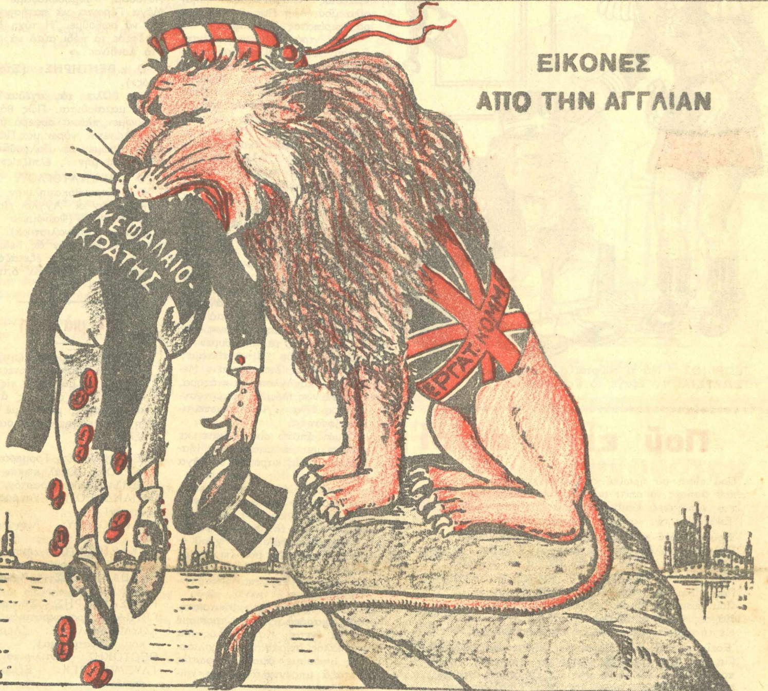
ΕΙΚΟΝΕΣ ΑΠΟ ΤΗΝ ΑΓΓΛΙΑΝ