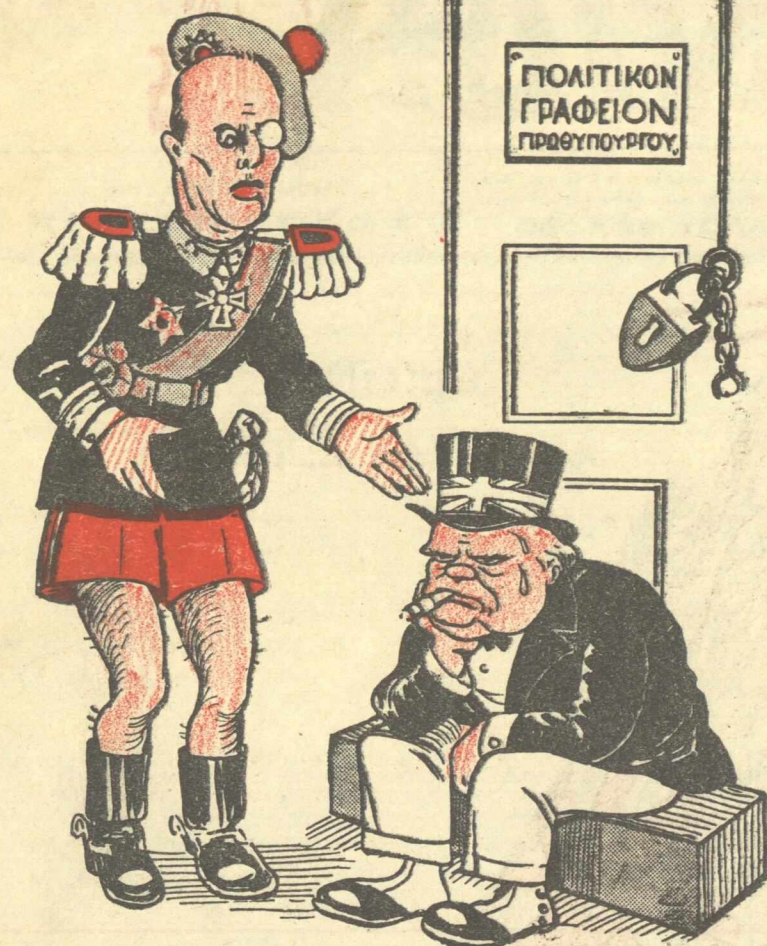
ΓΕΩΡΓΙΟΣ: Μά τί σοφταίεις 'κά με θρίζεις; ΤΣΩΡΤΣΙΑ: Μ' έφαγε τὸ ποδαρικό σου!...