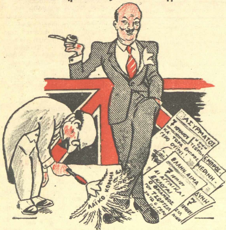
ΜΑΞΙΜΟΣ: Δεχθῆτε ἐξοχότατες τὰς εὐλακρινεστάτας εὐχὰς μας! ΑΤΑΥ: Μά τίς διαβάζω ἀπὸ τίς 7 Ἰουλίου στὶς ἐφημερίδες σας!