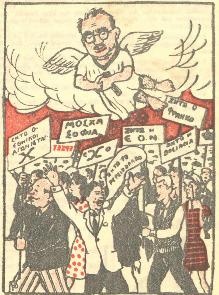
ΜΕΤΑΞΑΣ: Για δέσ καιρό που διάλεξε ο Χάρος, να με πάρη!..