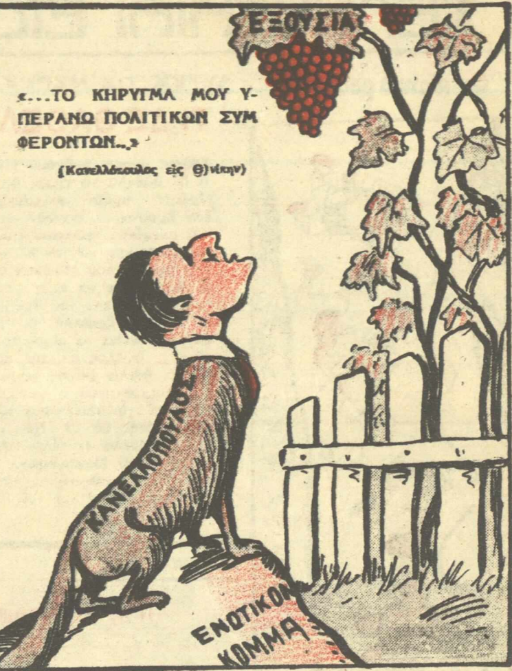
Η ΛΑΩΠΗΣ: Ὅμψακες εἶσι! (Ἐβῆν: Ὅσα δὲ φτάνει ἢ Ἄλεποῦ τὰ κάνει κρεμαστῆρια).

Ἄρα, εἶναι φῶς φεγγάρι, κι' ἂς τὸ ξέρει ἡ ἀνθρωπότης, θὰ τὴν πᾶραμεν γιὰρ εἶναι τῆς Ἑλλάδος... μειωνότης.