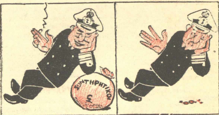
ποῦ στηρίζονταν πρῶτα ἢ Κυθέρηνσις Βαλγάρη...