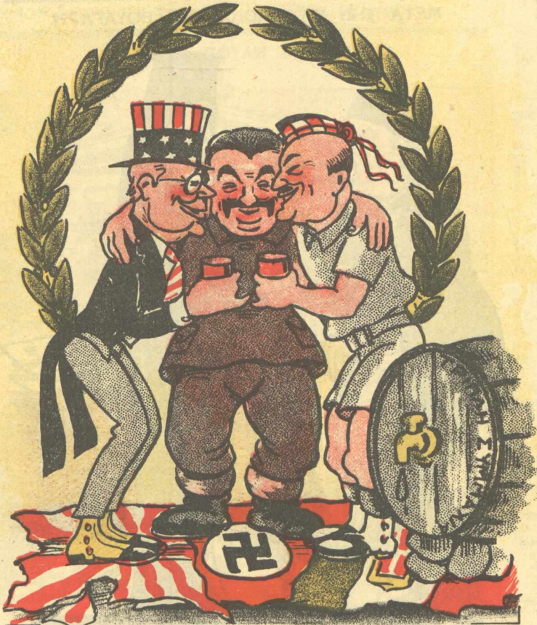
ΤΡΟΥΜΑΝ: Τόν φάγαμε και τόν τρίτον. ΣΤΑΛΙΝ: Είς ύγειαν μας λοιπόν!