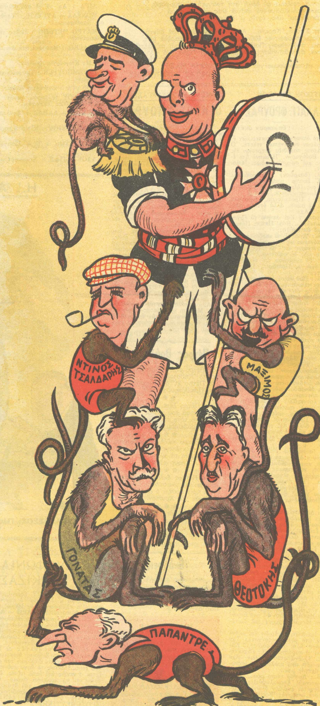
‘Ο μαϊμουδιάρης και οι μαϊμούδες του!