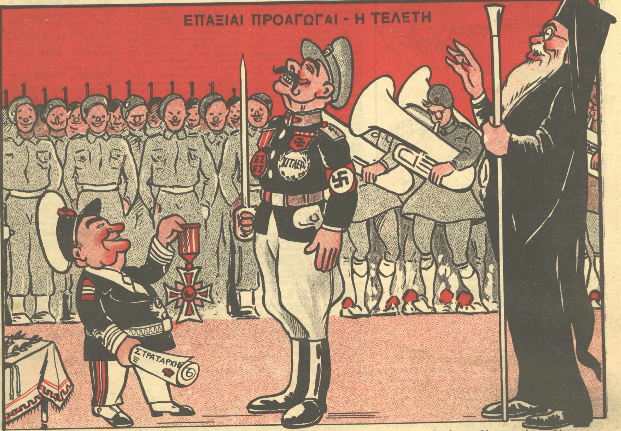
ΒΟΥΛΓΑΡΗΣ. — Ως πιστῶς συνεργασθέντα μετὰ τοῦ στρατοῦ κατοχῆς, ὡς ἀρχηγὸν τῶν "Ες - "Ες, ὡς καταβάσαντα καὶ ἐκτελέσαντα ἀνεπιθυμητοὺς Ἕλληνας, ὡς ἀσπόνδον ἐχθρὸν τῶν Συμμάχων, σὲ ἀνακηρύσσω διὰ τὴν δράσιν σου ἀξίον τῆς Πατρίδος, σοῦ δίδω τὸν Μεγαλόσταυρον καὶ σὲ προάγω εἰς στρατάρχη τῆς Ἑλλάδος!...