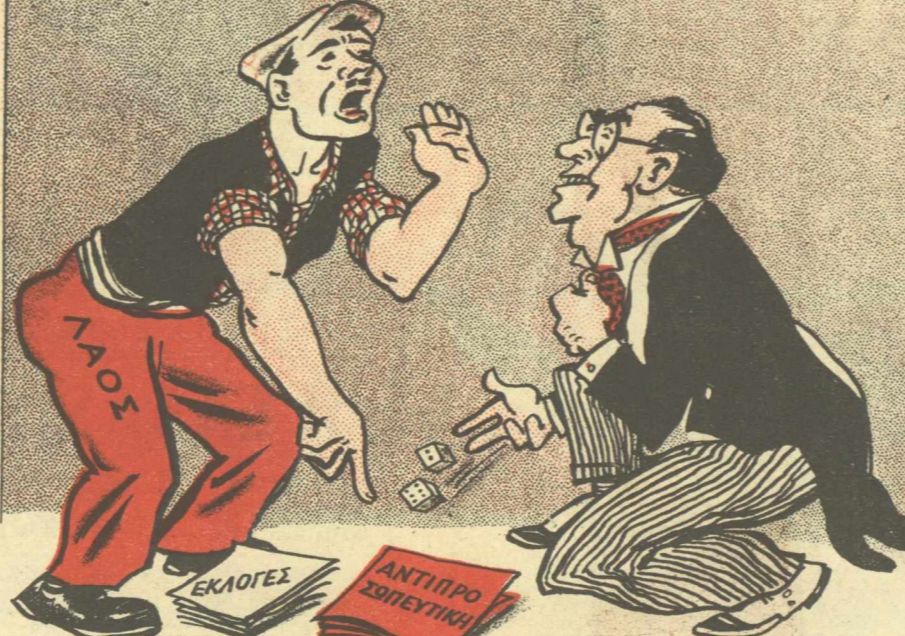
Ο ΛΑΟΣ. — Κοιμένα, κ. Μπεβίν. Αλλά μπρός και κείνα πίσω!