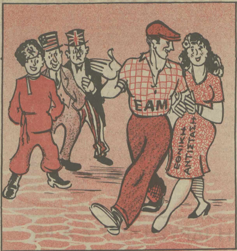
ΕΚΕΙΝΟΣ. — Άγάπη μου είμαστε το πιό ταιριασμένο ζευγάρι κι' όλος ό κόσμος μάς ζηλεύει.