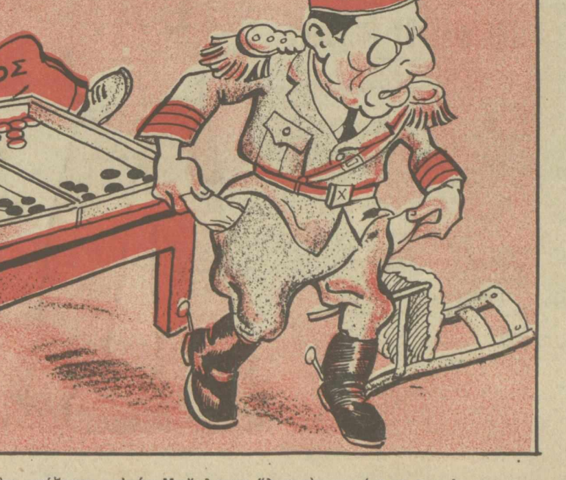
ΓΛΥΜΠΟΥΡΓΚ. — Δέν παίζεται αυτός,Μουκλειοε δλες τις «ο ρ τ ε ρ»!