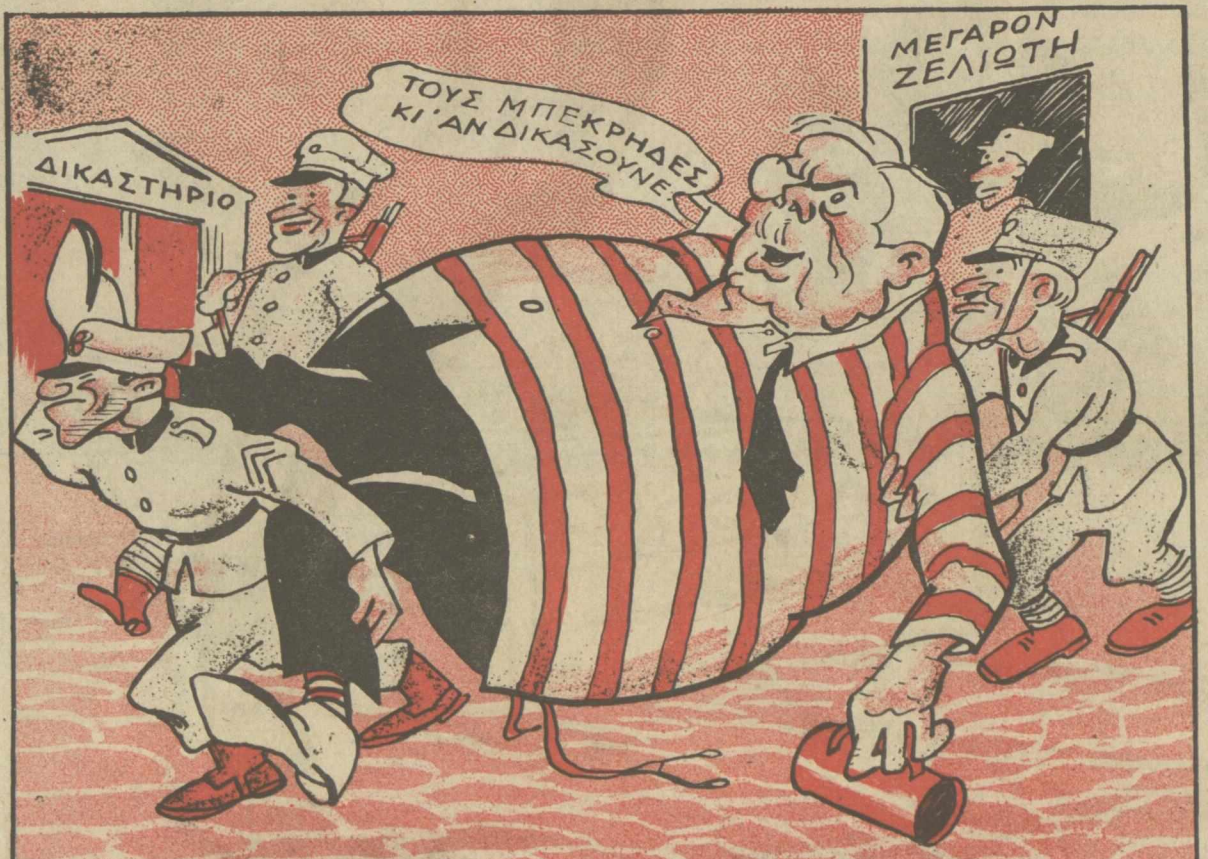
Η ΜΕΤΑΦΟΡΑ ΤΟΥ ΜΟΥΣΤΟΥ