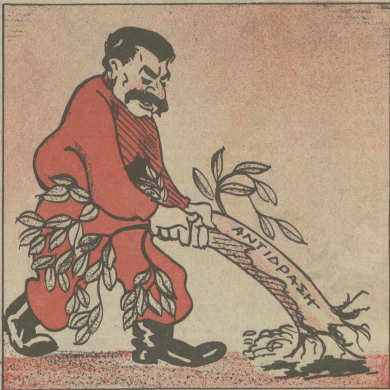
ΣΤΑΛΙΝ. — Έ, ρε κάτι καρδαμώματα πούχω τώρα τελευταία! Μπορώ νά ξεριζώσω 100 τέτοια δέντρα στό λεπτό.

Η εφημερίς «Ακρόπολις» προέβη αυτήν την εβδομάδα σε νέες συνταρακτικές αποκάλυψεις: — Πώς ό Πολύμερος Μοσχοβίτης ανέκαλυσεν τόν Κολόμβον εις τήν Άμερικήν και τόν Χίτλερ εις τήν.. Μόσχαν! Πώς ό Χίτλερ άφησε τό μουστάκι του νά μεγαλώσῃ κι' έγινε... Στάλιν κι' έκαμε... «κόκκινο φασισμό!» Βαρυσημαντες δηλώσεις τού Κολόμβου στόν κ. Μοσχοβίτη: «Έσένα, Πολύμερε, τό μυαλό σου είναι πιό κλόβιο από τό αυγό μου!» Απάντησις τού Πολύμερου: «Σέ γε λάσανε, άγαπητέ Κολόμβε. Κλόβια είναι τά μυαλά των άναγνωστών μου, έστω κι' αυτών των όλίγων πού διαβάσουν αυτά πού γράφω και τά ποιούν τοις μετρητοίς. Η αλήθεια είναι ότι έγώ τά γράφω... τοίς μετρητοίς! Και μή νομίσει, ότι έννοώ τά μετρητά πού μου δίνει ή «Ακρόπολις», γιά τά άρθρα μου. Αιτά οίτε τά ήπολογίζω...». Στά τελευταία του άρθρα ό Πολύμερος αποκάλυπτε, ότι στη Ρωσία υπάρχουν στρατόπεδα συγκεντρώσεως και βτι ή Ρωσία είναι ή μεγαλύτερη έχύρη ό τής Ελλάδος! Τήν άλλη εβδομάδα θ' αποκάλυψη ότι οι Γερμανοί, πού ήσαν στην Ελλάδα, δέν ήσαν Γερμανοί, αλλά... Ρώσοι, πού είχαν μάθει τά γερμανικά γιά νά... δυσφημήσουν τό φιλελληνικόν Τρίτο Ράιχ κι' ότι τό Χαϊδάρι ήταν... οσοικό στρατόπεδο συγκεντρώσεως!