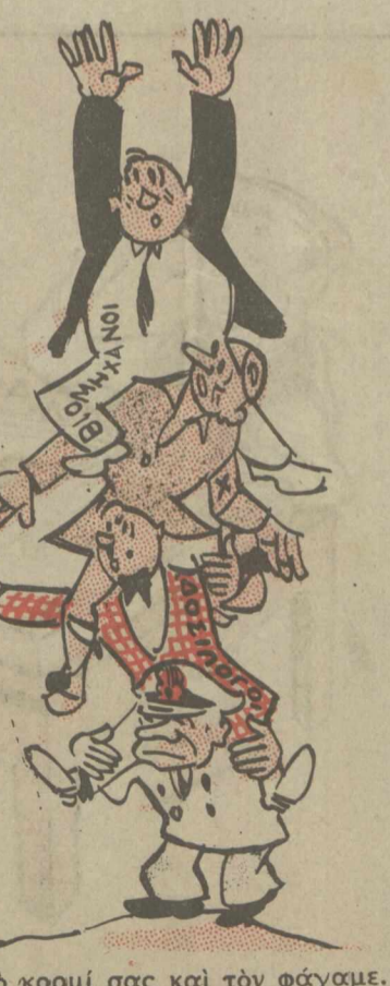
ΟΙ ΔΟΣΙΛΟΓΟΙ. — "Ισια τό κορμί σας και τόν φάγαμε.