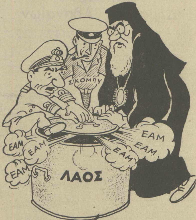
'Αλλὰ τὸ καζάνι ξεχείλισε!...