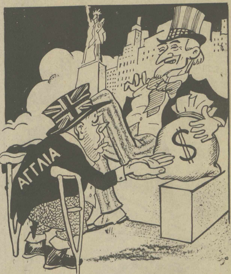
— Κάνε δολλάριο, ἀφεντικό, νὰ σχωρεθοῦν τ' ἀποθιμένα σου!...