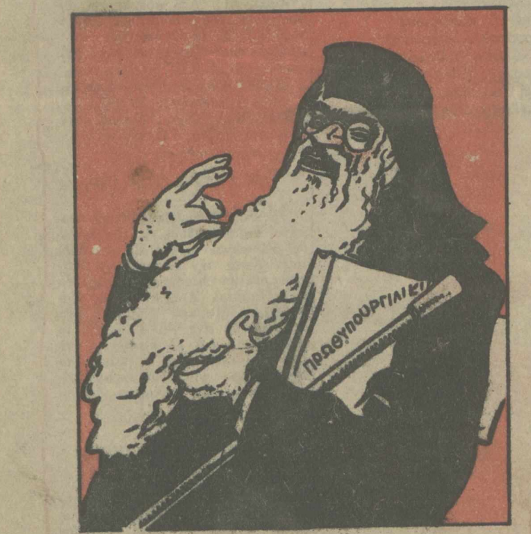
Ο Παπός βλογάει πρώτα τά γένεια του...