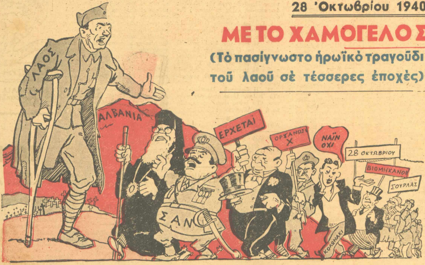
Ο ΠΟΛΕΜΙΣΤΗΣ: Μὲ ξένα κόλλυβα κάνετε μνημόσυνο; Ἐγὼ δὲ θυμᾶμαι νὰ εἶδα κανέναν ἀπὸ σᾶς στὴν Ἄλβανία