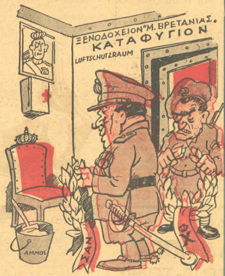
Κατάθεσις στεφάνων ἐκεῖ ὅπου ἠνδραγάθησε ὁ ἡρωϊκὸς Βασιλεὺς Γεώργιος Β΄...

Ὁ κ. Μοσχοβίτης συνεχίζων εἰς συνταρακτικὰς τὸ ἀποκαλύπτει, ὅ ἀποκαλύψει προσεχῶς ὅτι εἶνε δική του καὶ ἡ... Ἀποκάλυψις τοῦ Ἰωάννου.