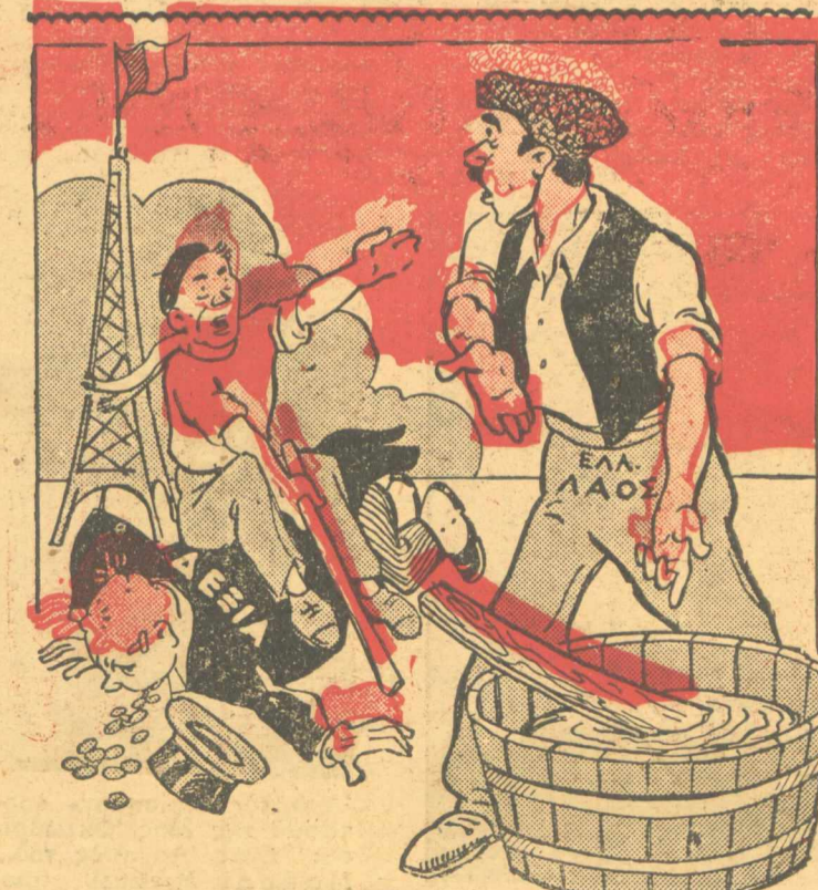
Ο ΓΑΛΛΙΚΟΣ ΛΑΟΣ... Ἐ, μὸν ἀμί! Ἡ σειρά σου τώρα! Ο ΕΛΛΗΝΙΚΟΣ ΛΑΟΣ... Ἐνοια σου καὶ τὴν ἔχω στὸ μούσκιο τῆ σανίδα

Τί πρῶτῆ ἦταν ἐκεῖνο, τί ἀδέχαστο πρῶτῆ ἔυπησεν ὄλ' ἡ Ἑλλάδα στὸν σερφῆρον τὴ βοή Ἐπιτροπᾶ παιδιὰ καὶ μάνες ρώτασαν γιατί χτυποῦνε τῆσο δυνάτᾶ οἱ καμπάνες; Μαύρα σύννεφα σκεπάζαν τὸ γαλάζιο οὐρανὸ μᾶς. Μὰ τὰ ὄπλα τοῦ Μπενίτο δὲ λυγίσαν τὸ λαὸ μᾶς. Γιατί ὁ Ζαχαριάδης μὲς ἀπὸ τὴ φιλική του φῶναξε μὲ τὴ γενναία καὶ ἡρωϊκὴ φωνὴ του: «Μιτρός ἀδέρφια ἠνωμένοι πέστε μὲ ἡρωισμό! Νὰ τσακίσουμε γιὰ πάντα τὸ μπαμπῆσι Φασισμοῦ!» Καὶ στὴ Μόροβα, στὴ Πίνδα, στὴς Κλεισοῦρας τὰ στενά Στὰ φαράγγια, στὰ λαγγάδια, στὰ βουνὰ σὲ κάθε ῥέμμα Γράφτηκε τὸ μέγα Ἐπος ποῦ θὰ ζεῖ παντοτεινὰ. Μὲ τὸ αἷμα τοῦ λαοῦ μᾶς, μὲ τῆς Ἐργατικῆς τὸ Αἷμα! Ἄλλοι σπεῖραν κ' ἄλλοι τώρα προσπαθοῦνε νὰ θεωρήσονται. Ἄλλοι θένε μὲ παρόπτες νάβγουν τῶρα νικηταί! Τοῦ λαοῦ ὅμως τὰ μάτια δὲν μποροῦν νὰ τὰ σφολιασῶν. Γιατί ὁ λαὸς στὸν ὕμνο δὲν ἐπίσπησε ποτέ!