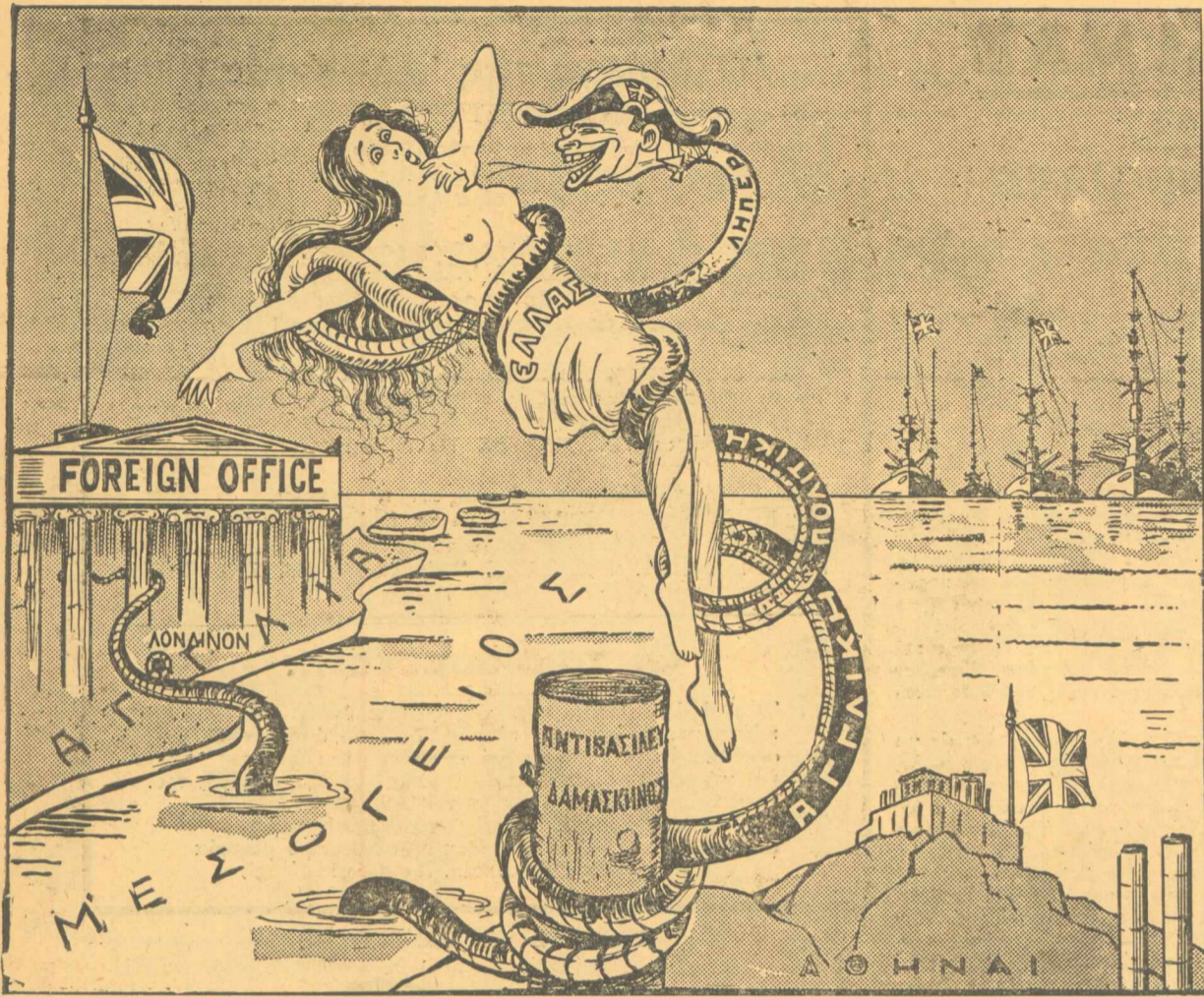
Η ΑΓΓΛΙΚΗ ΠΟΛΙΤΙΚΗ ΣΤΗΝ ΕΛΛΑΔΑ

— Πώς δεν έχει. Οι «εθνικόφρονες» από τήν στιγμή που έμαθαν ότι κατέχω τόν μυστικό της βόμβας, κόντευαν να σάσουν από τή χαρά τους. — Καλά, μαζί με τήν Άμερικη δεν έχατε κάνει τήν εφεύρεση; — Μισή - μισή. Δηλαδή έκείνη τήν άνακάλυψε και μεϊς άπειλούσαμε. Τώρα έκείνη μιάς άπειλεί και μεϊς τήν άνακάλυπτουμε. — Ποιά; Τήν βόμβα; — Όχι, τήν γκάρα μας! — Μιά τελευταία ερώτηση, κ. Μπέβιν! Δεν μου λέτε, ή Ρωσία κατέχει τόν μυστικό της βόμβας; — Τόν μυστικό της βόμβας δεν ξέρω. Πάντως τόν μυστικό τόν δικό μου, ότι δεν έχω τή βόμβα, τόν ξέρει άποσθήποτε. — Άς οψεται ό Κολόμβος που άνακάλυψε... τήν Άμερικη!