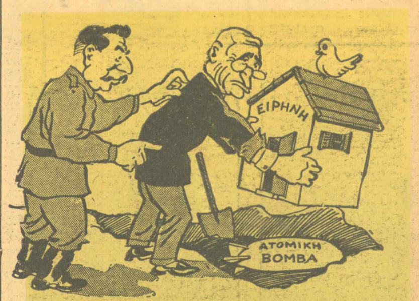
ΣΤΑΛΙΝ. — Καί πιστεύεις ότι σε τέτοια θεμέλια κτιζεται τόν σπύτι;